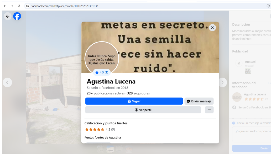
Figura 3: Publicación activa en Facebook Marketplace correspondiente a la oferta de vivienda/casilla de madera tipo machimbrada, donde se observan imágenes del producto, descripción y opciones de contacto.