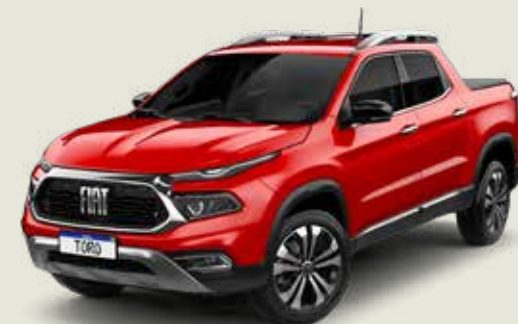
176 - Rojo Tribal