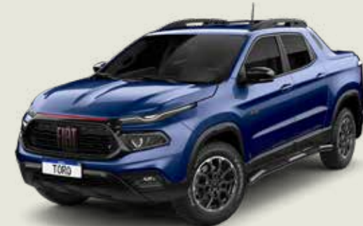
345 - Azul Jazz