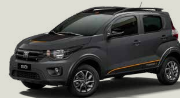
979 - Gris Silverstone