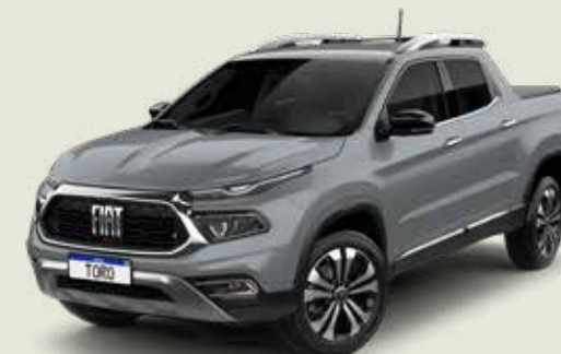
503 - Gris Sting