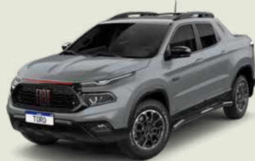
503 - Gris Sting