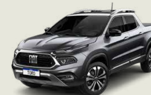
847 - Gris Granito