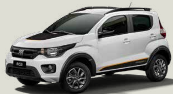
249 - Blanco Banchisa