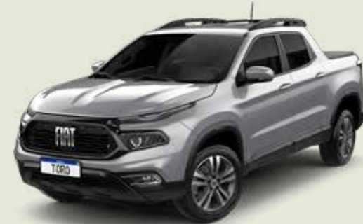
097 - Billet Silver