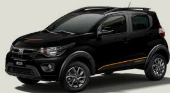
806 - Negro Vulcano