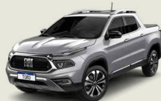
097 - Billet Silver