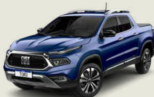
345 - Azul Jazz