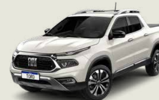
742 - Blanco Polar