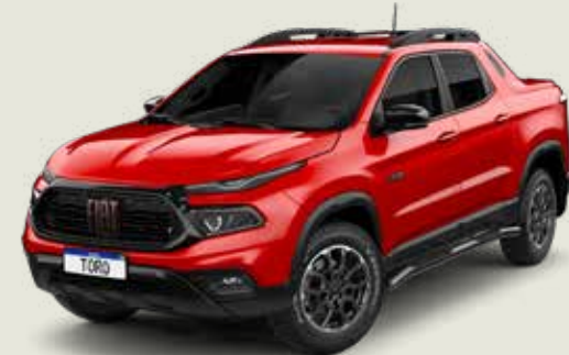
176 - Rojo Tribal