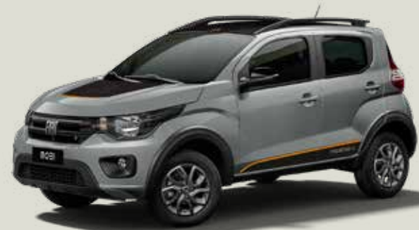
619 - Plata Bari