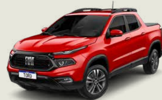
176 - Rojo Tribal