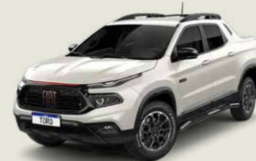
742 - Blanco Polar