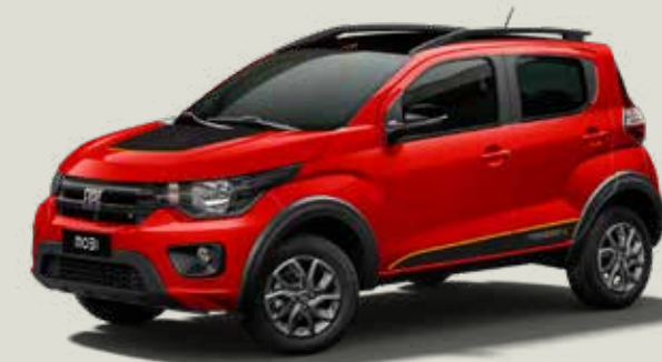
978 - Rojo Montecarlo