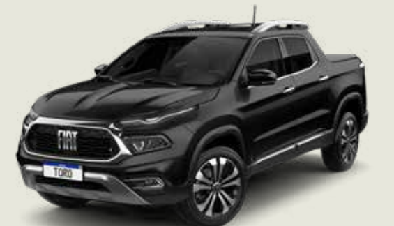
852 - Negro Carbono