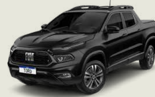
852 - Negro Carbono