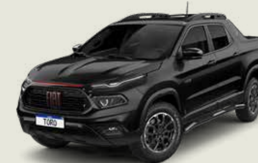
852 - Negro Carbono