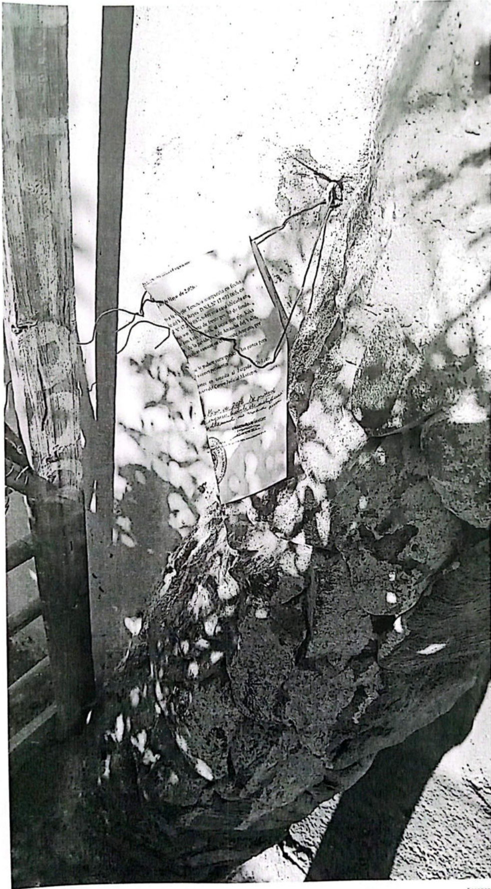
Escaneado con CamScanner