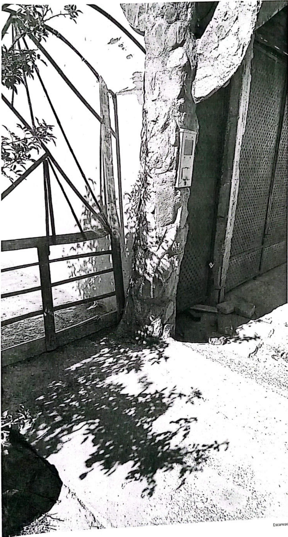
Escaneado con CamScanner