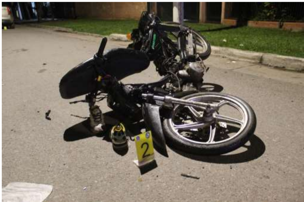
FOTOGRAFÍA N°04: Realizada parte frontal de la motocicleta.