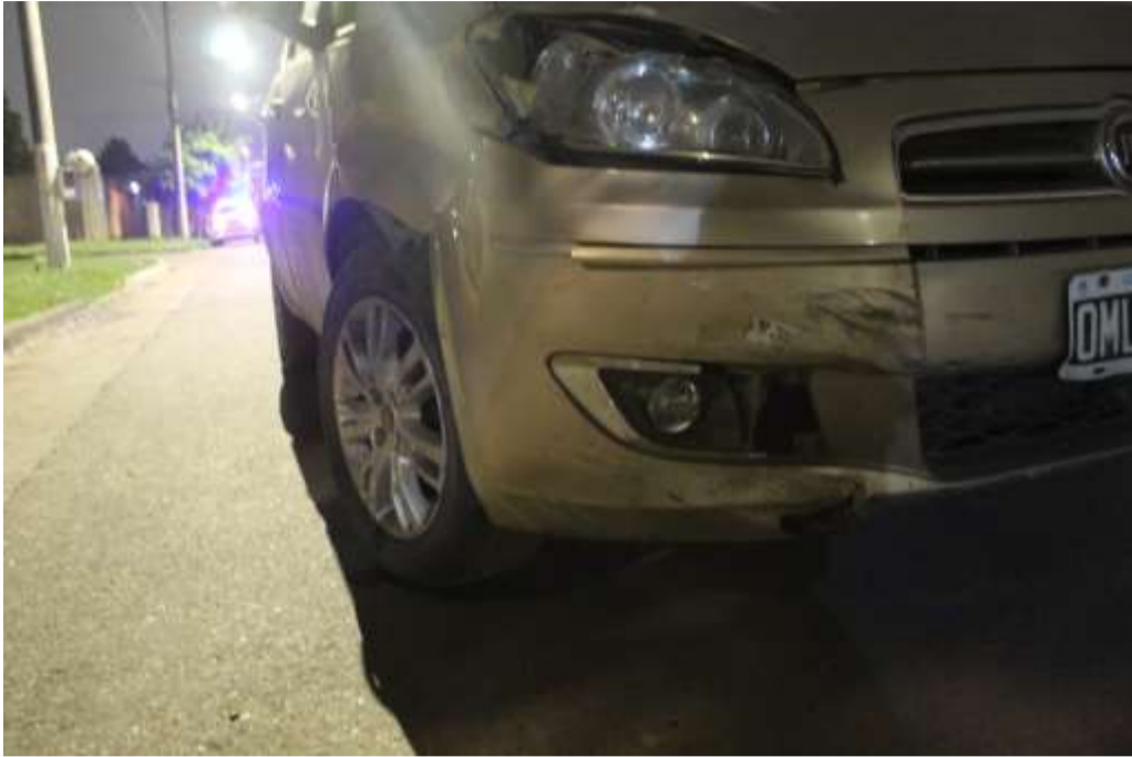
FOTOGRAFÍA N°12: Realizada con más aproximación a los daños..