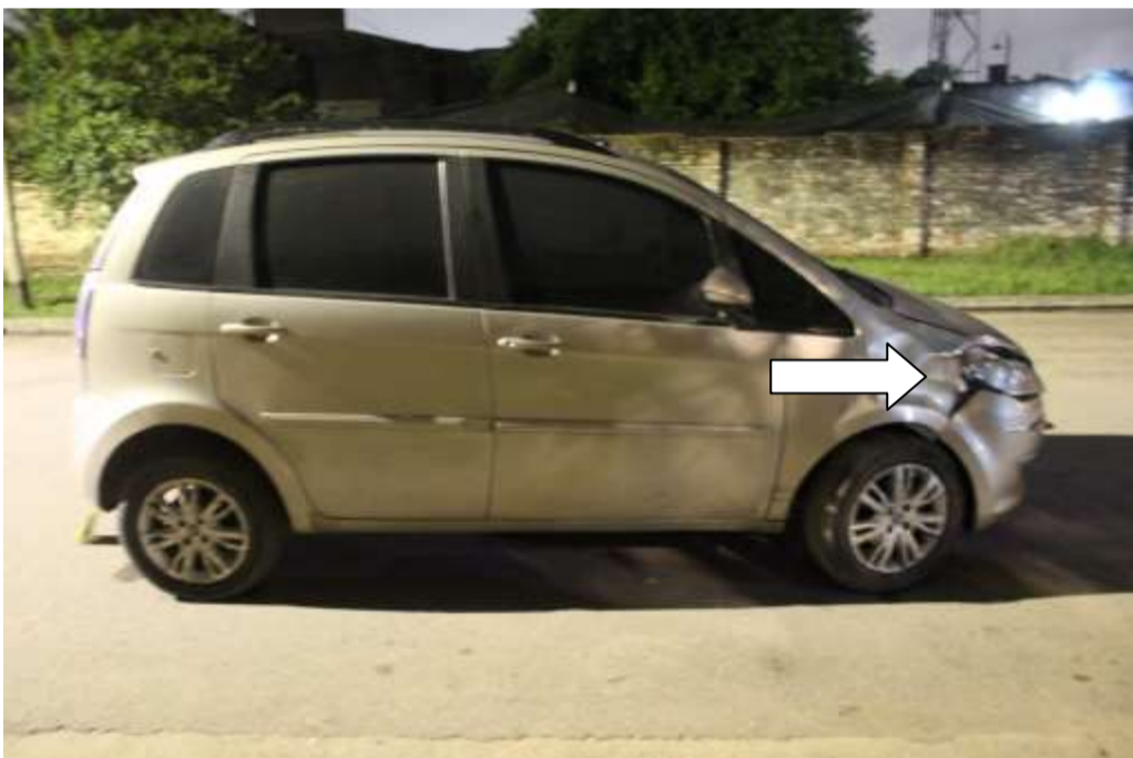
FOTOGRAFÍA N° 13: Realizada parte lateral derecho del vehículo, donde indico con flecha los daños.