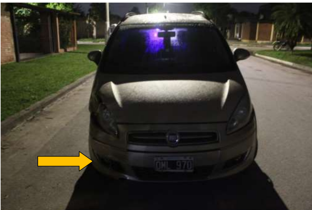
FOTOGRAFÍA Nª 11: Realizada parte frontal del vehiculo, donde indico con flecha los daños.