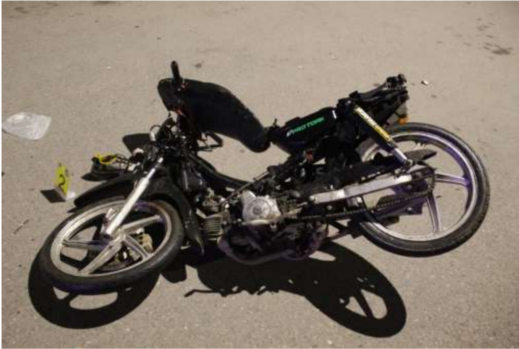
FOTOGRAFÍAS Nª 06: Realizada hacia la parte lateral izquierdo de la motocicleta GILERA.