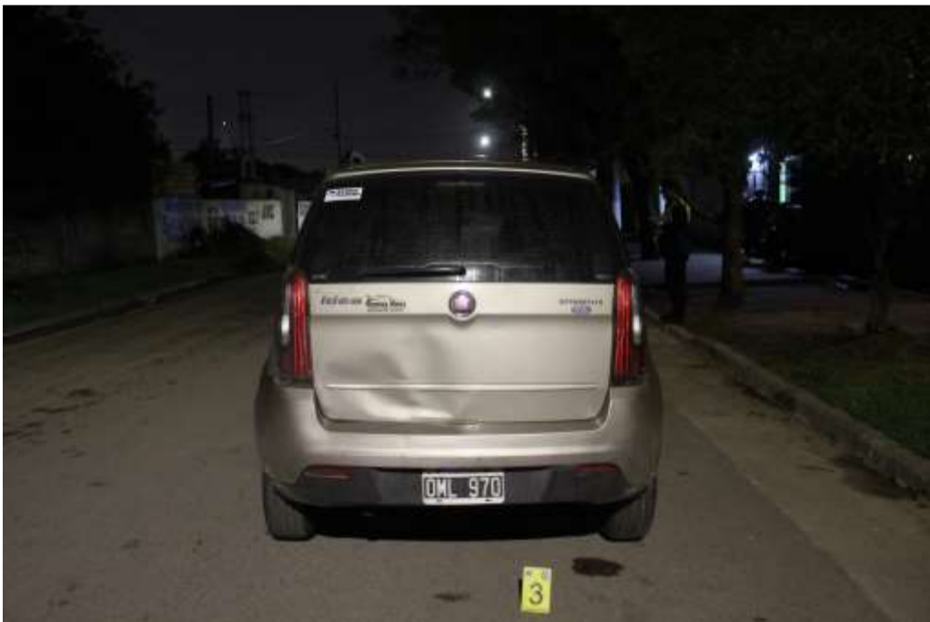
FOTOGRAFÍA Nª 09: Realizada parte trasera del vehículo FIAT IDEA.