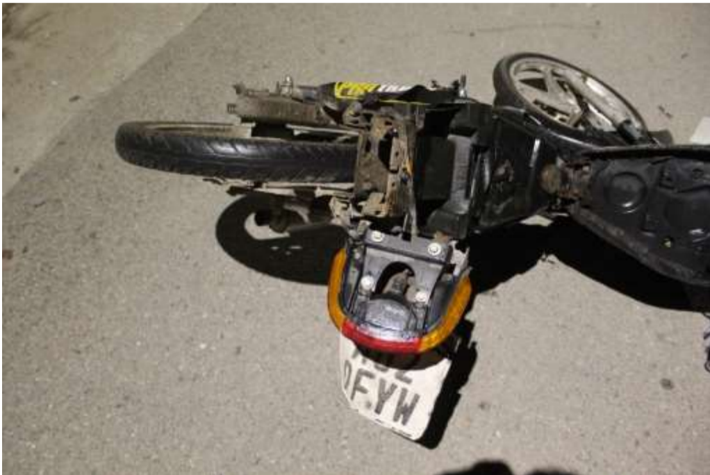
FOTOGRAFÍA Nª 08: Idem fotografía anterior con más aproximación a los daños.