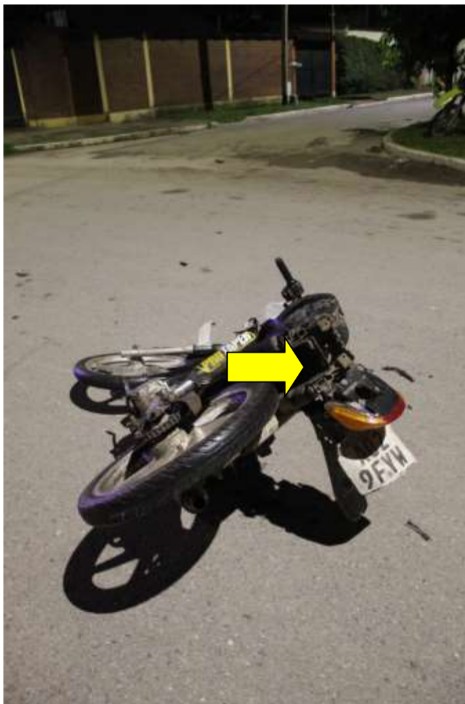
FOTOGRAFÍA Nª 07: Realizada parte trasera de la motocicleta, donde indico con flecha los daños.