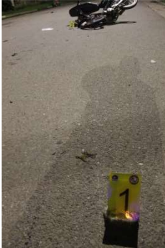
FOTOGRAFÍA Nª 04: Realizada con más aproximación hacia la fricción metálica.