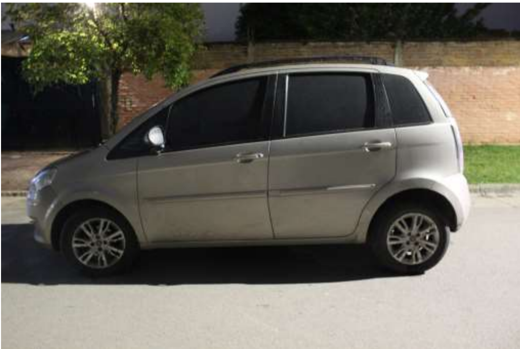
FOTOGRAFÍA Nª 10: Realizada parte lateral izquierdo del vehículo.