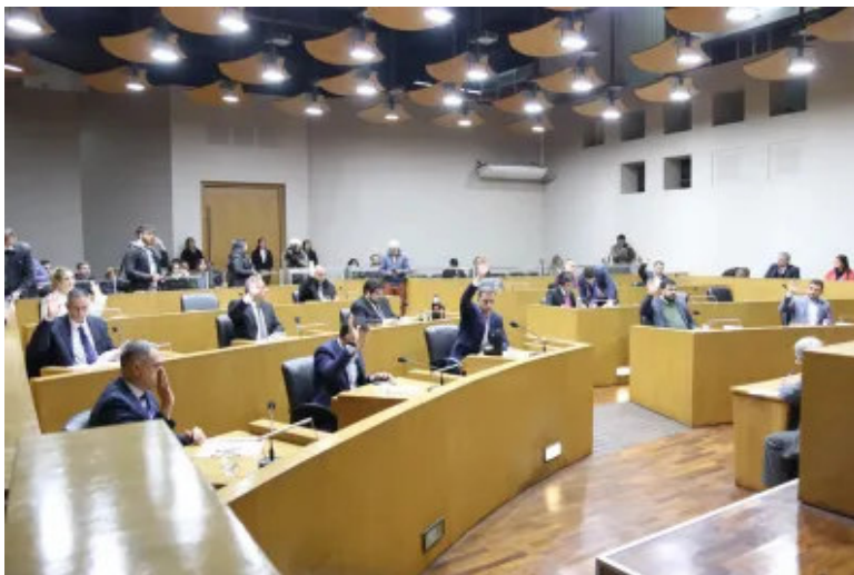
Torre de Inclusión en la capital: se aprobó, pero se pidió conciencia ambiental