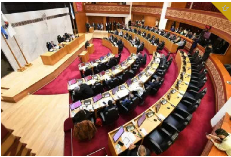
Doce claves para entender cómo será el digesto jurídico