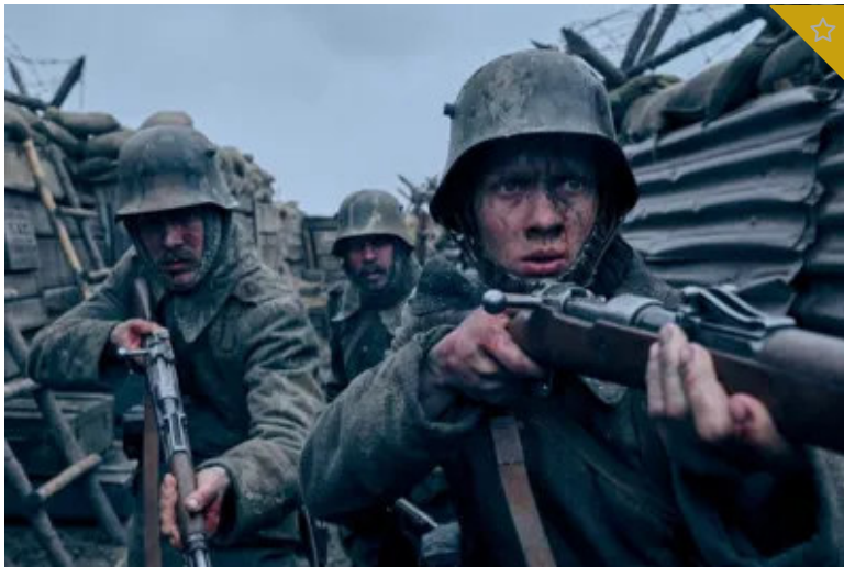
Sin novedad en el frente opositor a Jaldo... por ahora