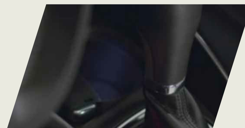
KIT ILUMINACION INTERIOR