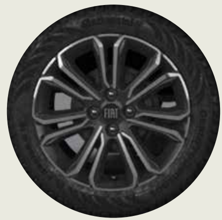
Llanta de aleación 16" OPC