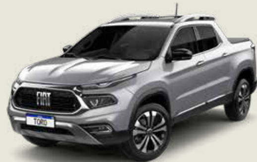
097 - Billet Silver