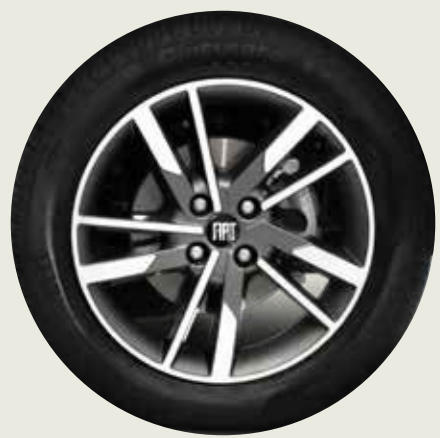
Llantas de aleación 16" SERIE