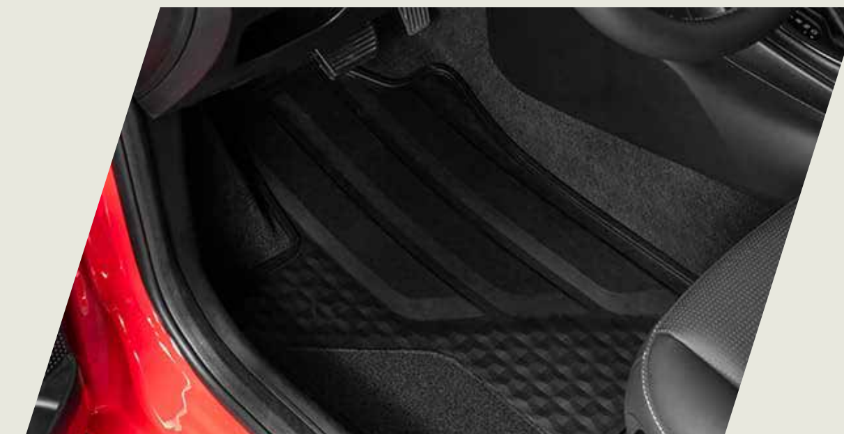
CUBRE ALFOMBRA TEXTIL CON GOMA