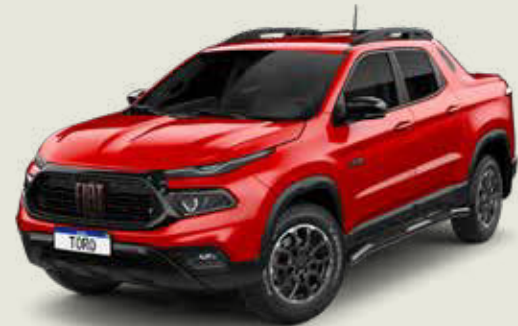
176 - Rojo Tribal