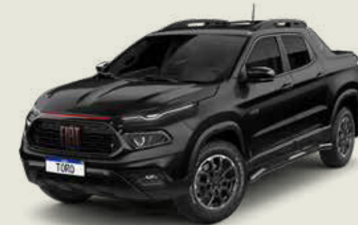
852 - Negro Carbono