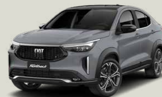
766 | GRIS STRATO + NEGRO VULCANO