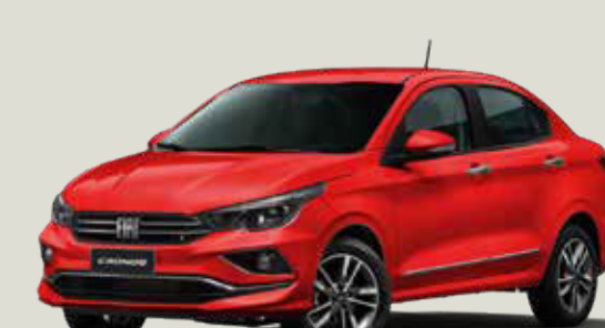
978 - Rojo Montecarlo