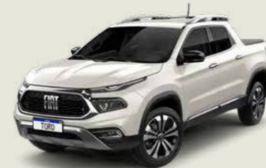
742 - Blanco Polar