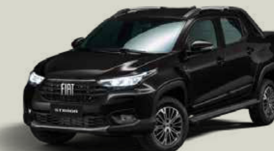
806 - Negro Vulcano