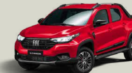
978 - Rojo Montecarlo