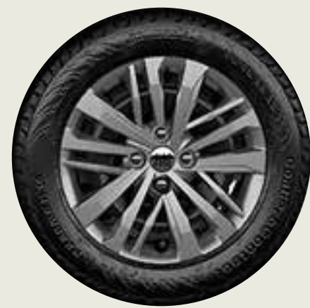
Llantas de acero 15" OPC