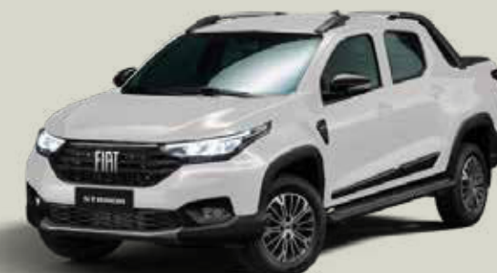
249 - Blanco Banchisa