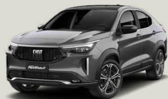
175 | GRIS SILVERSTONE + NEGRO VULCANO