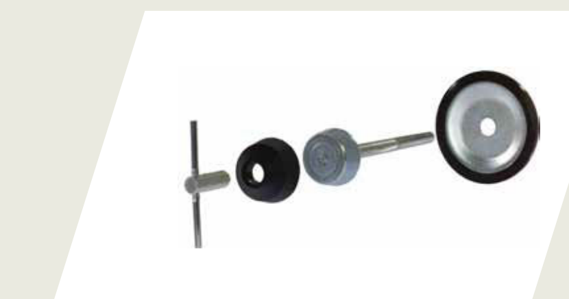
BULÓN DE SEGURIDAD PARA RUEDA DE AUXILIO