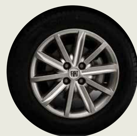
Llantas de aleación 15" SERIE