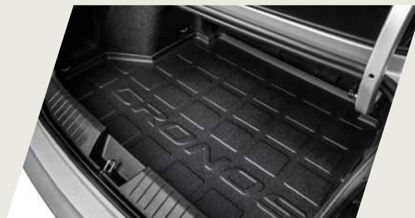
ALFOMBRA BAUL ANTIDERRAME