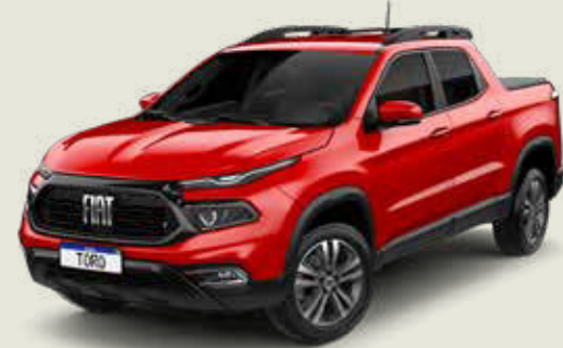
176 - Rojo Tribal