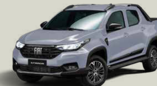
540 - Gris Strato