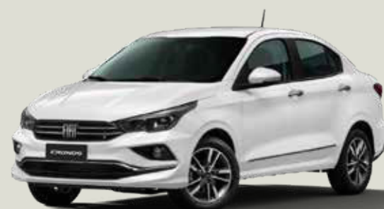
249 - Blanco Banchisa