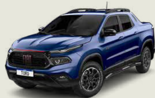
345 - Azul Jazz