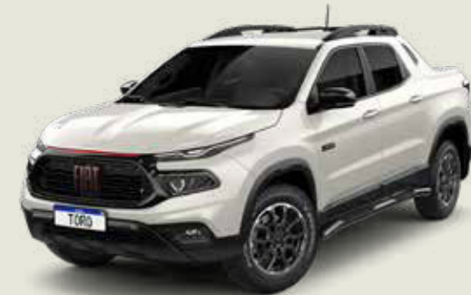
742 - Blanco Polar