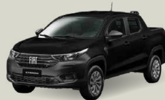
806 - Negro Vulcano