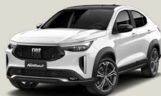
743 | BLANCO BANCHISA + NEGRO VULCANO