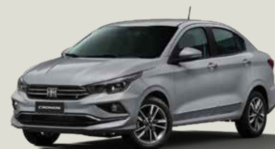
619 - Plata Bari