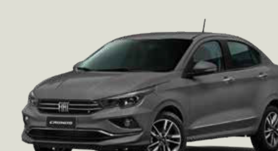
979 - Gris Silverstone