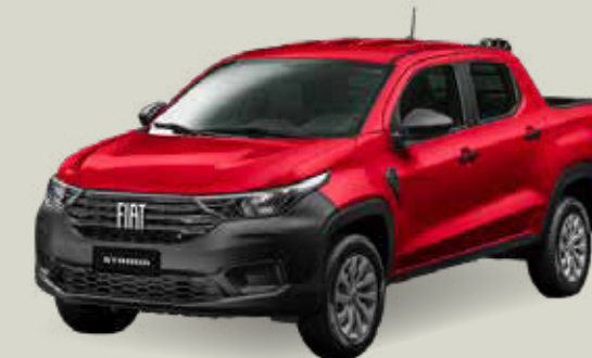
978 - Rojo Montecarlo