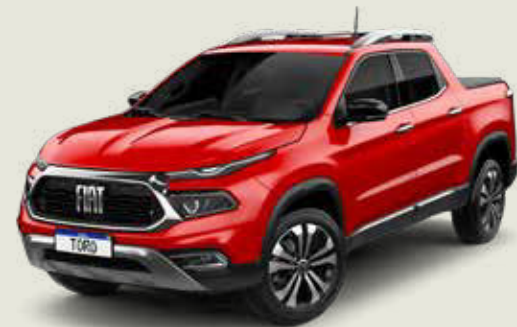
176 - Rojo Tribal