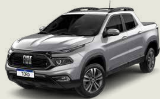
097 - Billet Silver