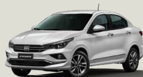
534 - Blanco Alaska