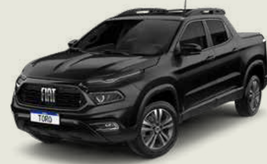
852 - Negro Carbono