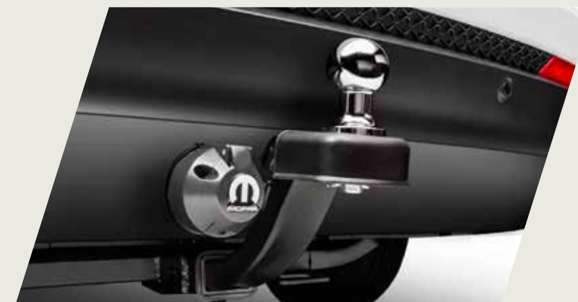
GANCHO DE REMOLQUE