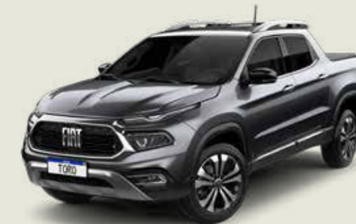
847 - Gris Granito