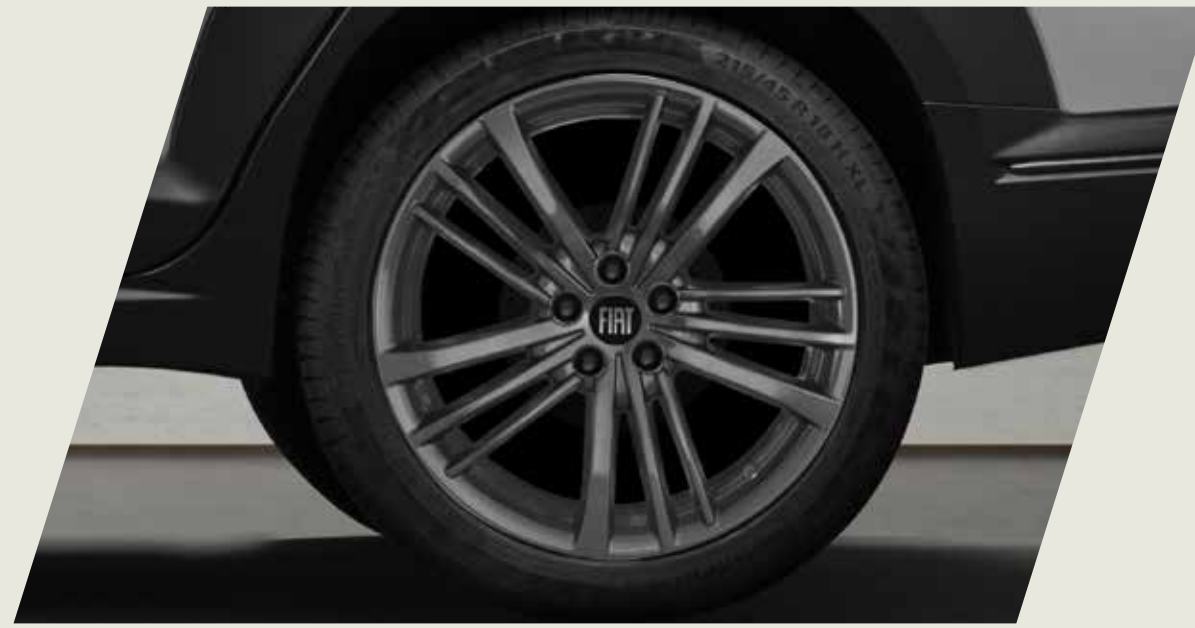
LLANTAS DE ALEACIÓN DE 17", TAMAÑO 6, COLOR EXCLUSIVO

Acercate a un concesionario y conocé la gama de accesorios originales que Mopar te ofrece para equipar tu FIAT Fastback, seguido de las imágenes de cada accesorio.