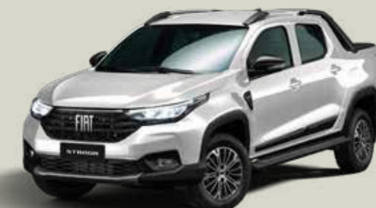
619 - Plata Bari