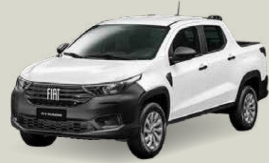
249 - Blanco Banchisa