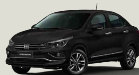
806 - Negro Vulcano