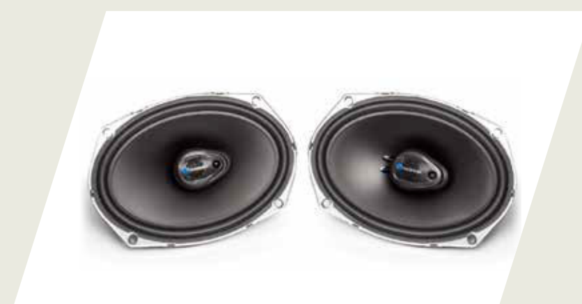
KIT PARLANTES TRASEROS