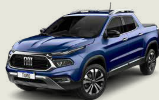
345 - Azul Jazz