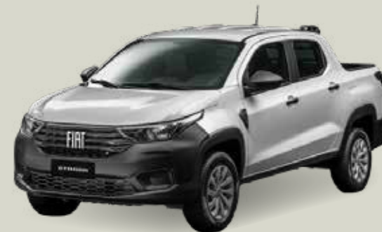
619 - Plata Bari