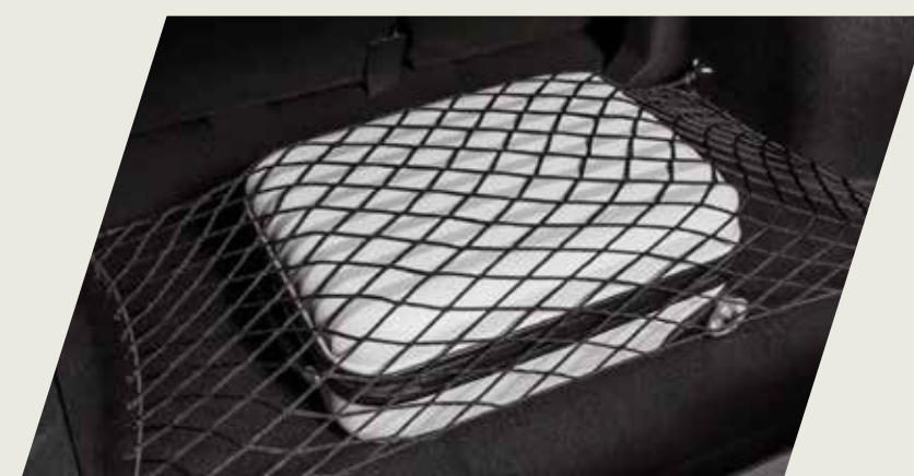
RED ELÁSTICA PARA BAUL