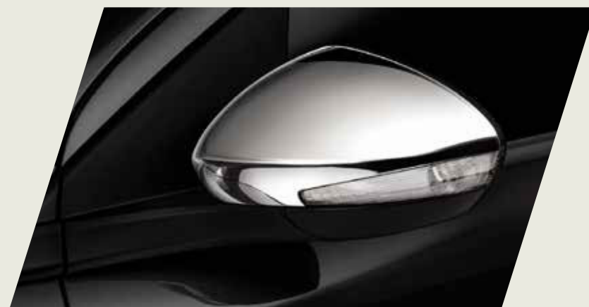
TAPA ESPEJO RETROVISOR EXTERNO CROMADO

Acercate a un concesionario y conocé la gama de accesorios originales que mopar te ofrece para equipar tu fiat Cronos, seguido de las imágenes de cada accesorio.