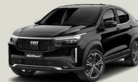
806 | NEGRO VULCANO MONOCOLOR