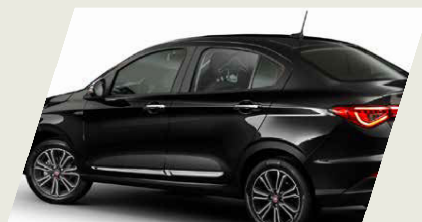
MOLDURA DE PUERTA CROMADA