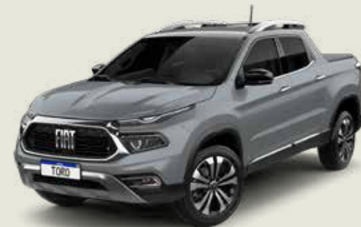
503 - Gris Sting