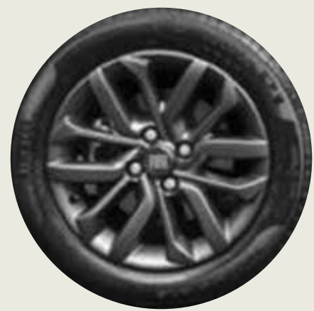
Llantas de aleación negra 15" OPC