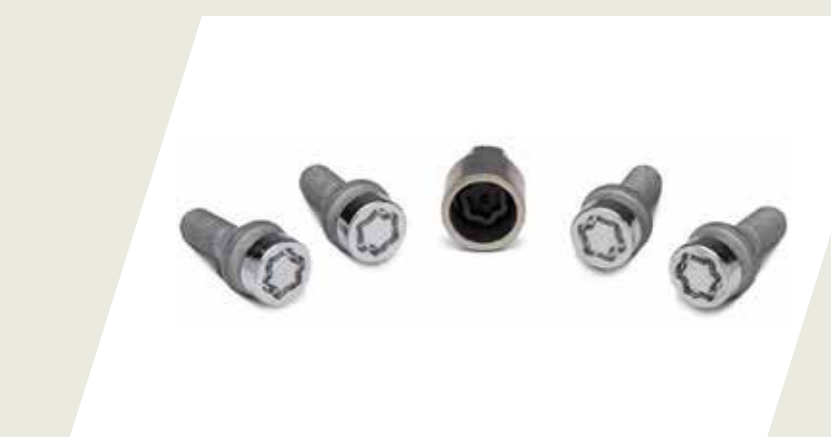
JUEGO DE TORNILLOS ANTIROBOS PARA RUEDA