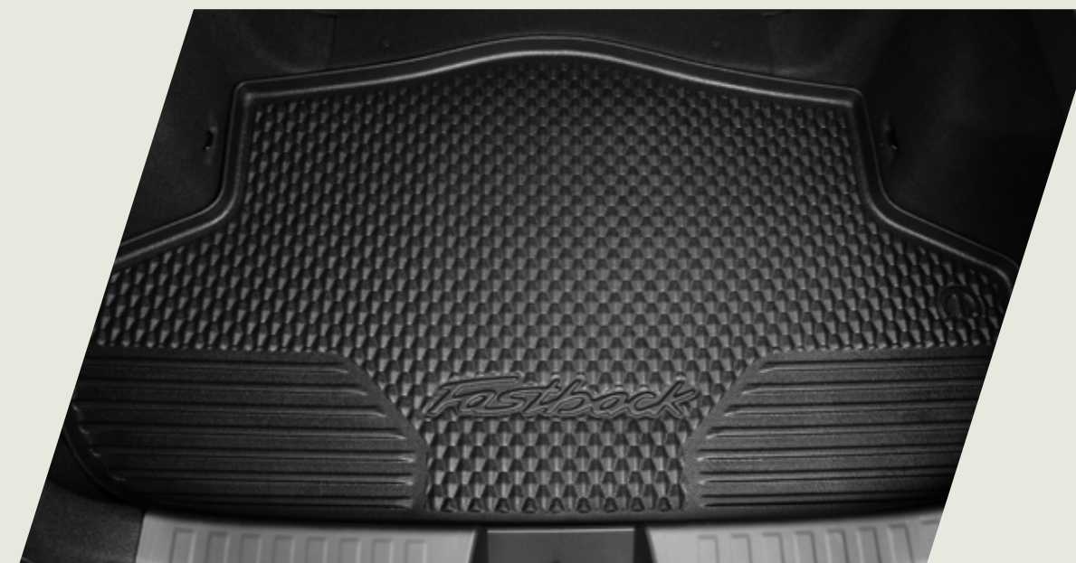
ALFOMBRA PARA BAÚL CON BORDES ELEVADOS