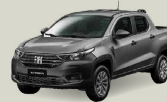
979 - Gris Silverstone