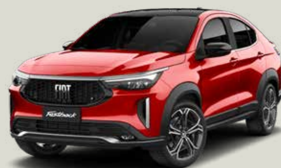
663 | ROJO MONTECARLO + NEGRO VULCANO