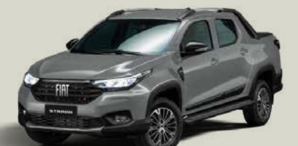
979 - Gris Silverstone