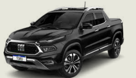
852 - Negro Carbono