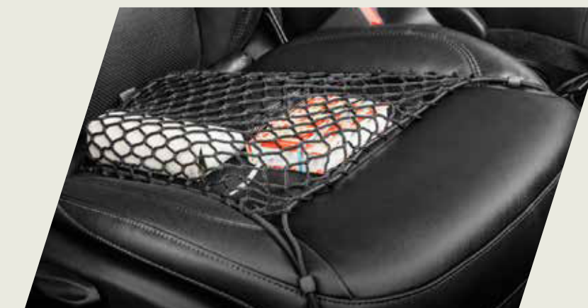
RED ELÁSTICA DE ASIENTO DELANTERO