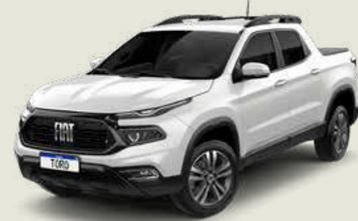
296 - Blanco Ambiente