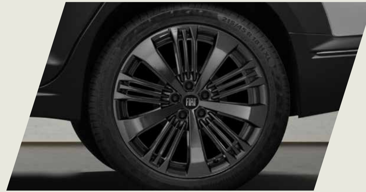
LLANTAS DE ALEACIÓN DE 17", TAMAÑO 7, COLOR EXCLUSIVO