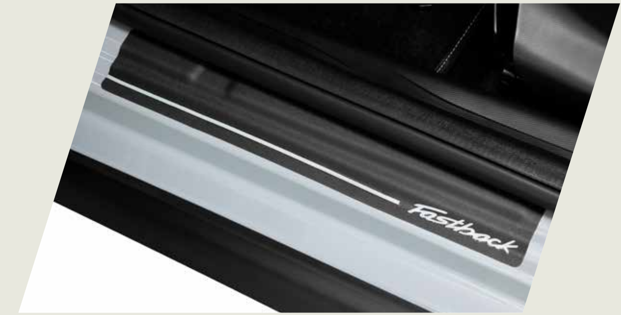
PROTECTOR DE ZÓCALO - VINILO