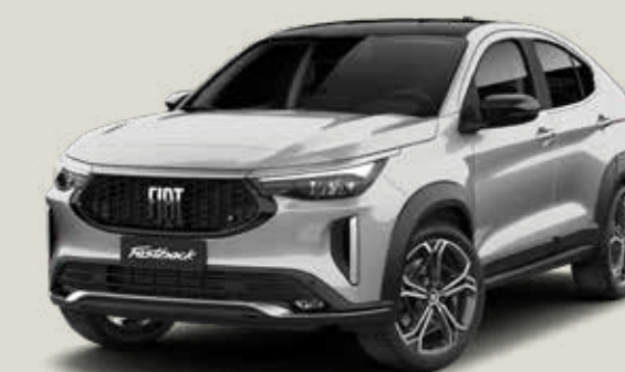
832 | PLATA BARI + NEGRO VULCANO