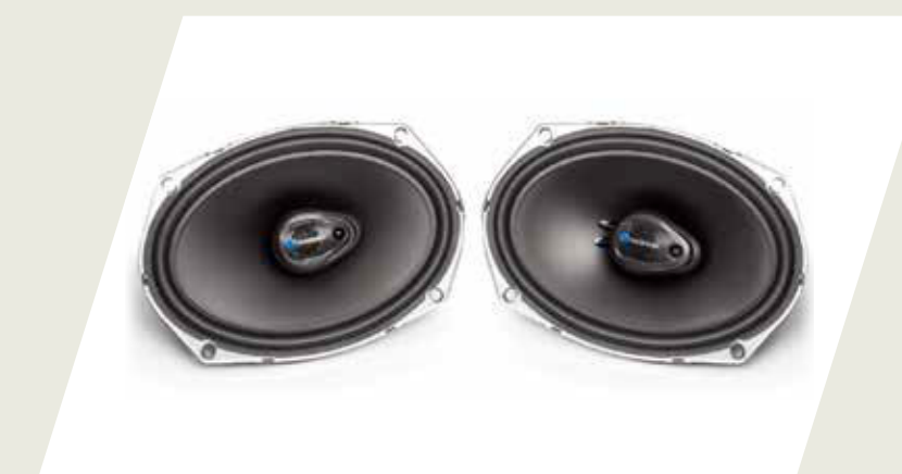
KIT PARLANTES DELANTEROS