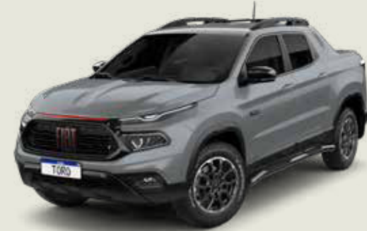
503 - Gris Sting