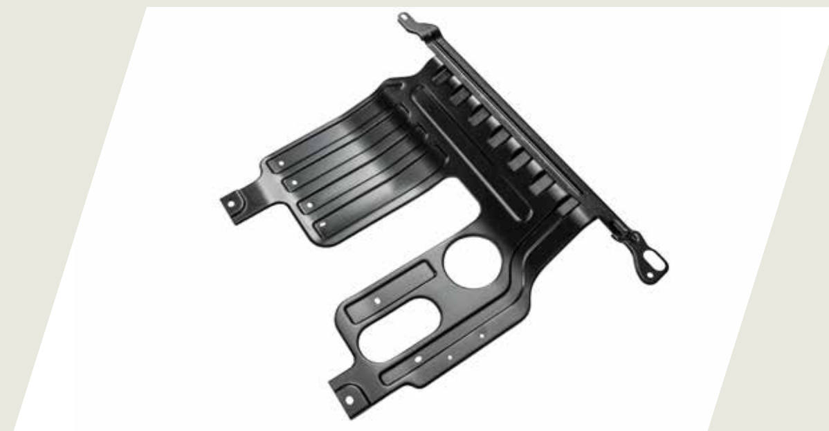
PROTECTOR DE CARTER