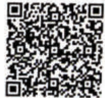
ESC. NATALIA NASI VOCAL SUPLENTE