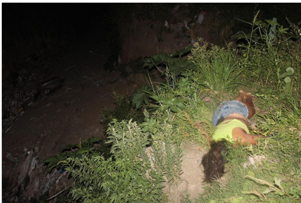
FOTOGRAFIA N° 31: Toma fotográfica ídem a la anterior desde otro