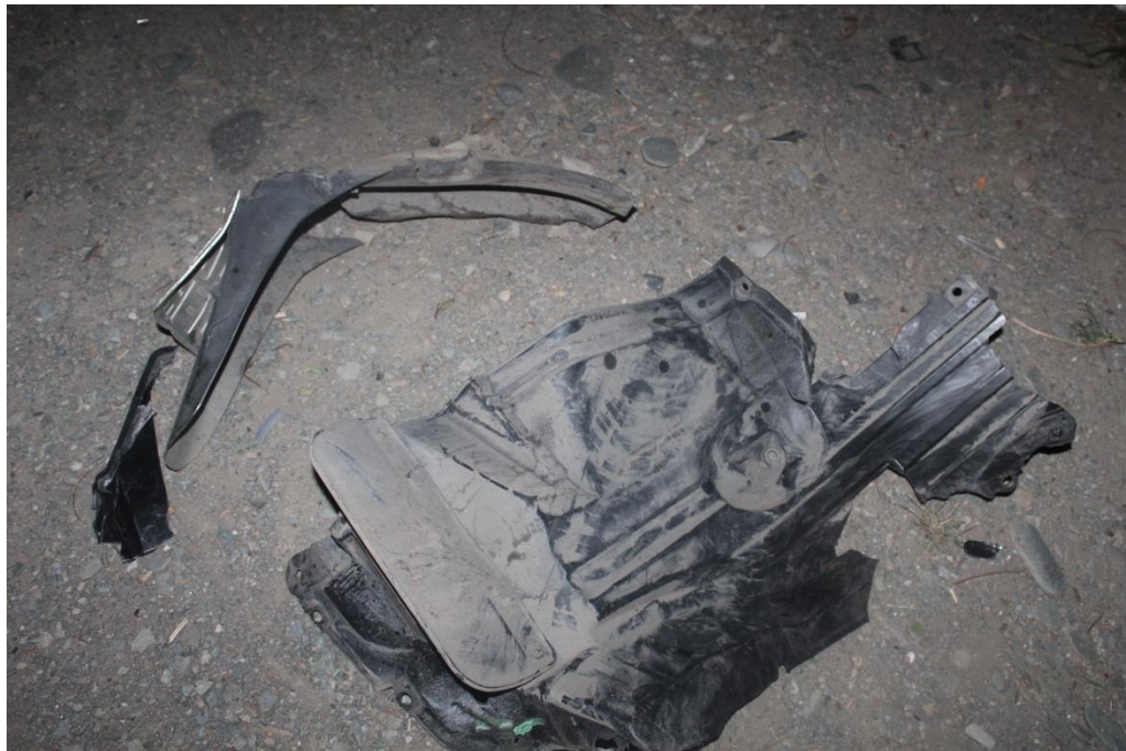
FOTOGRAFIA N° 16: Toma fotográfica con mayor aproximación a los plásticos oscuros mencionados en toma anterior.