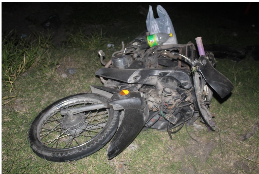
FOTOGRAFIA N° 27: Toma fotográfica con aproximación a la parte delantera de la motocicleta marca KELLER, donde se observan daños.