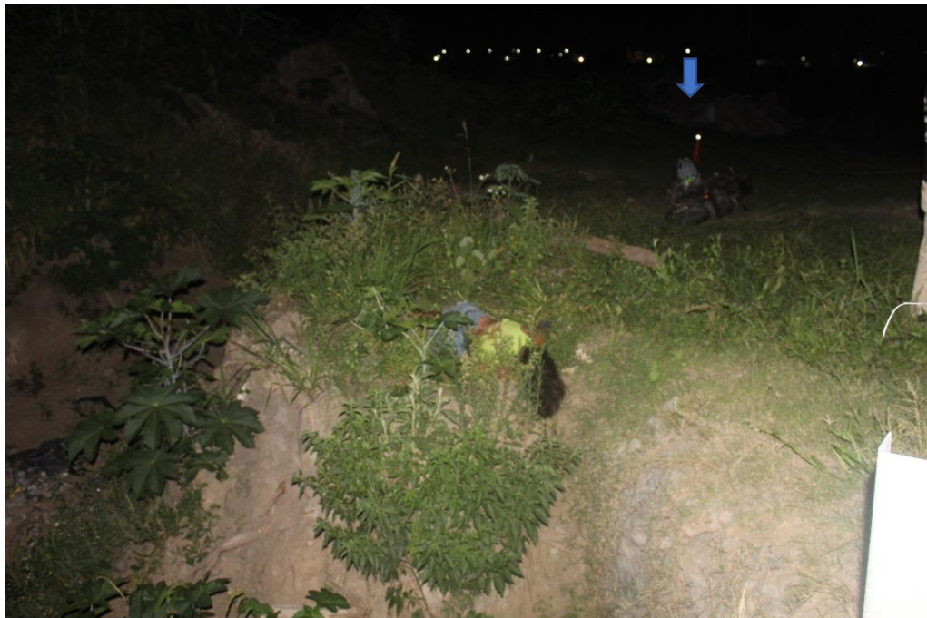
FOTOGRAFIA N° 30: Toma fotográfica realizada sobre el puente, desde el Cardinal SO a NE, donde se observa en primer plano el cuerpo sin vida de la víctima, posicionado en un lugar en pendiente al costado de una barranca perteneciente a una canal de aproximadamente 9 mts de profundidad, en segundo plano la motocicleta interviniente en el hecho indicada con flecha inserta.