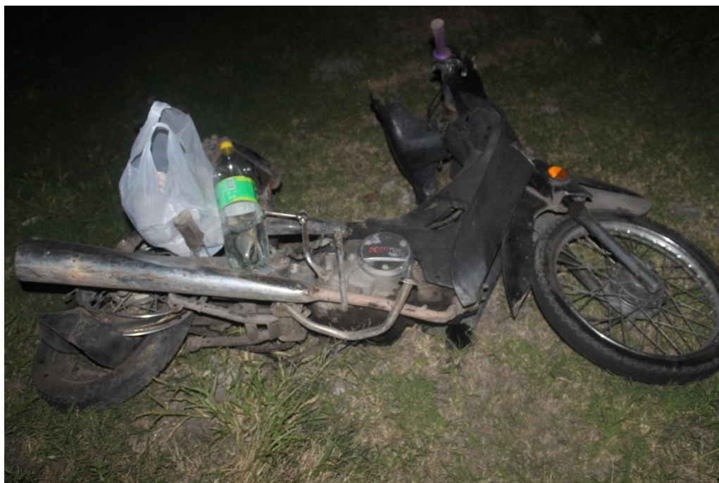
FOTOGRAFIA N° 29: Toma fotográfica con aproximación al lateral izquierdo de la motocicleta marca KELLER, donde se observan daños.