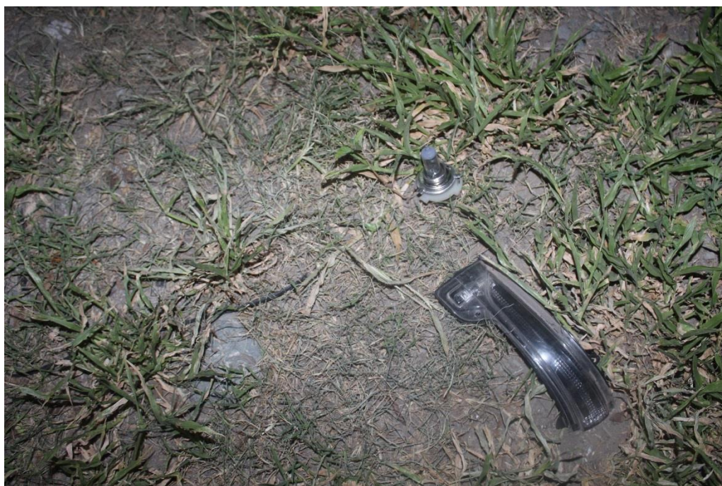
FOTOGRAFIA N° 23: Toma fotográfica realizada con aproximación a los acrílicos mencionados en toma anterior.