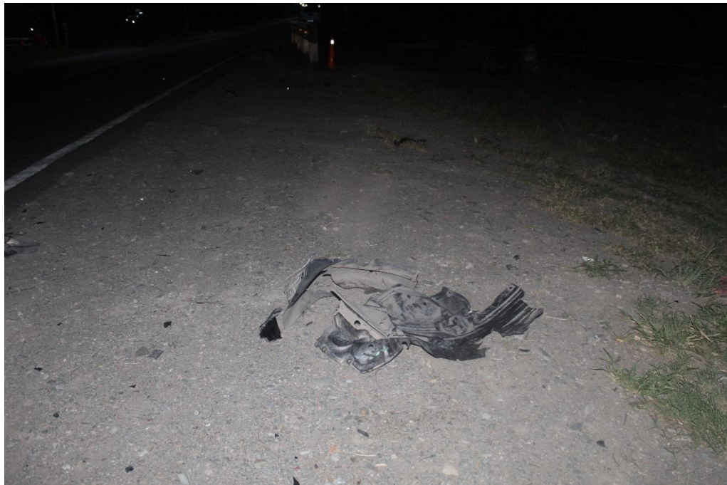
FOTOGRAFIA N° 14: Toma fotográfica realizada con aproximación, donde se observan en primer plano los plásticos color oscuros mencionados en toma anterior, y alrededor acrílicos dispersos y un calzado de goma color rosa.