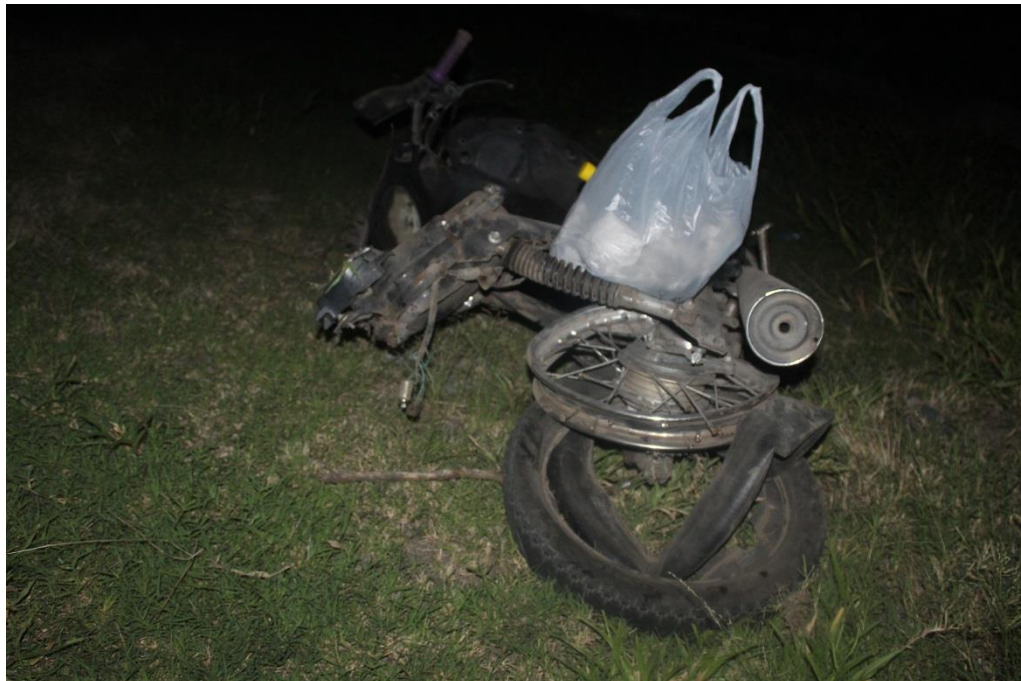
FOTOGRAFIA N° 28: Toma fotográfica con aproximación a la parte trasera de la motocicleta marca KELLER, donde se observan daños.