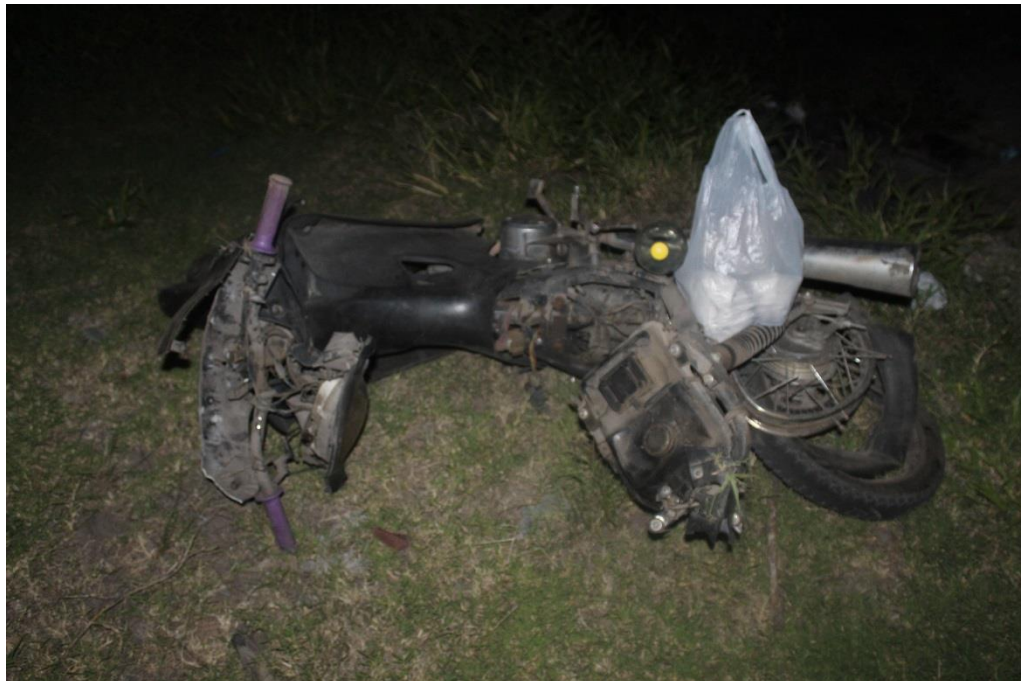
FOTOGRAFIA N° 26: Toma fotográfica con aproximación a la parte superior de la motocicleta marca KELLER, donde se observan daños.