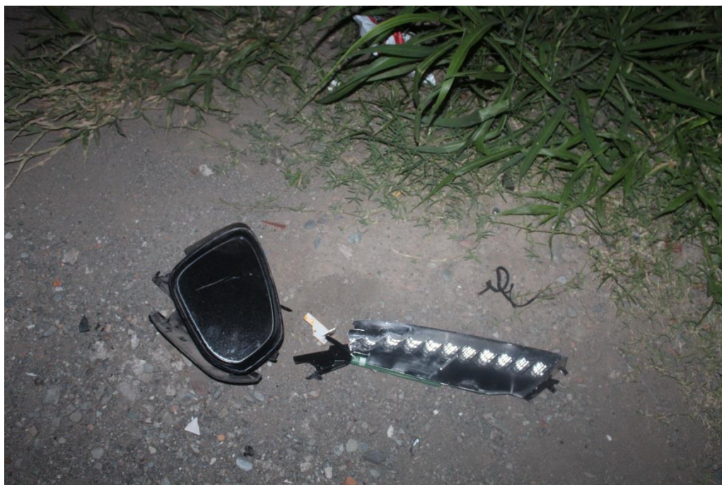
FOTOGRAFIA N° 21: Toma fotográfica realizada con aproximación, a la parte de retrovisor mencionado en toma anterior.