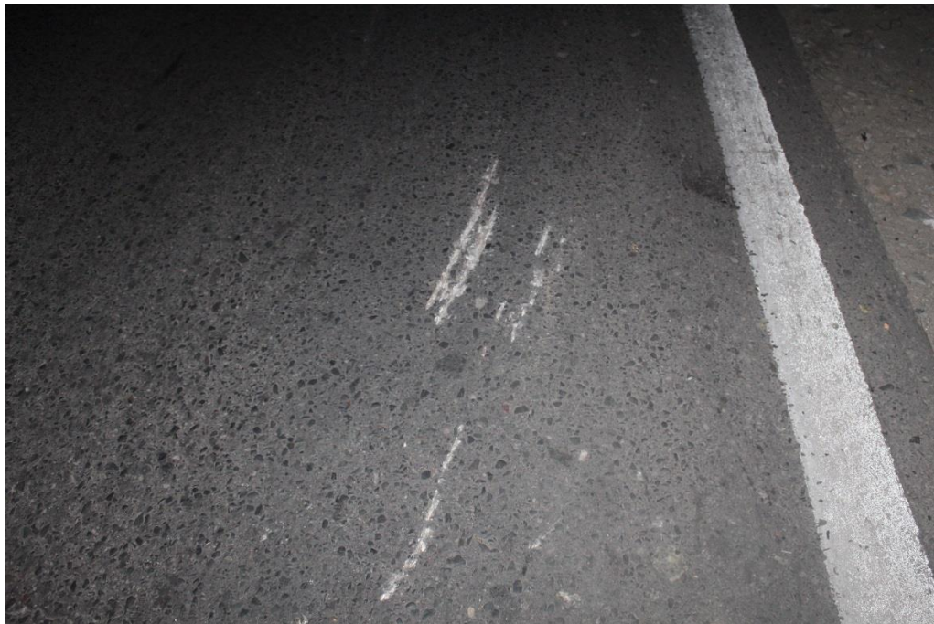
FOTOGRAFIA N° 04: Toma fotográfica realizada con aproximación al raspado metálico mencionado en Toma Nro 1.