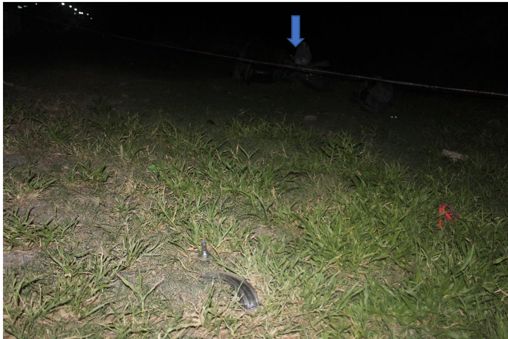
FOTOGRAFIA N° 22: Toma fotográfica realizada desde el Cardinal Norte a Sur, donde se observa en primer plano restos de acrílicos, en segundo plano, la motocicleta interviniente en el hecho, indicada con flecha inserta.