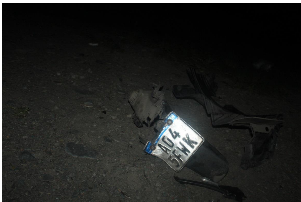
FOTOGRAFIA N° 17: Toma fotográfica realizada desde otro angulo a los plásticos oscuros , donde se observa en uno de ellos una chapa patente indicando el DOMINIO A04 5FWK.