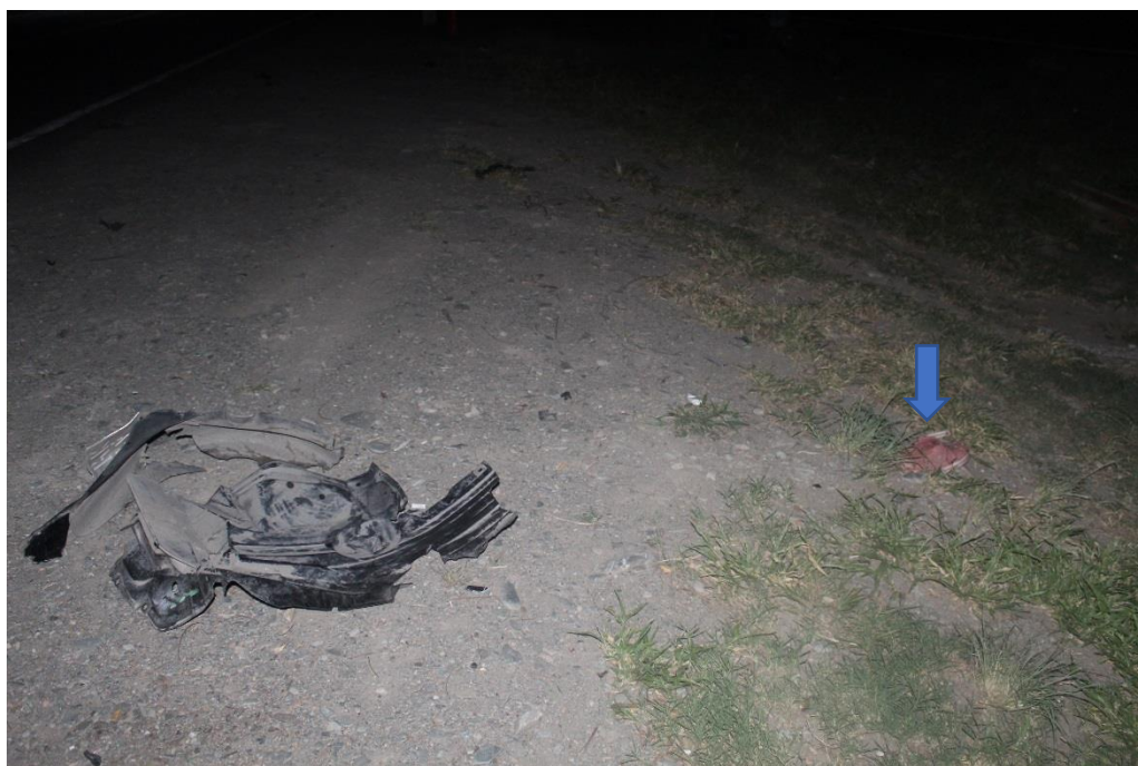
FOTOGRAFIA N° 15: Toma fotográfica ídem a la anterior con mayor aproximación, donde se indica con flecha inserta el zapato de goma color rosa.