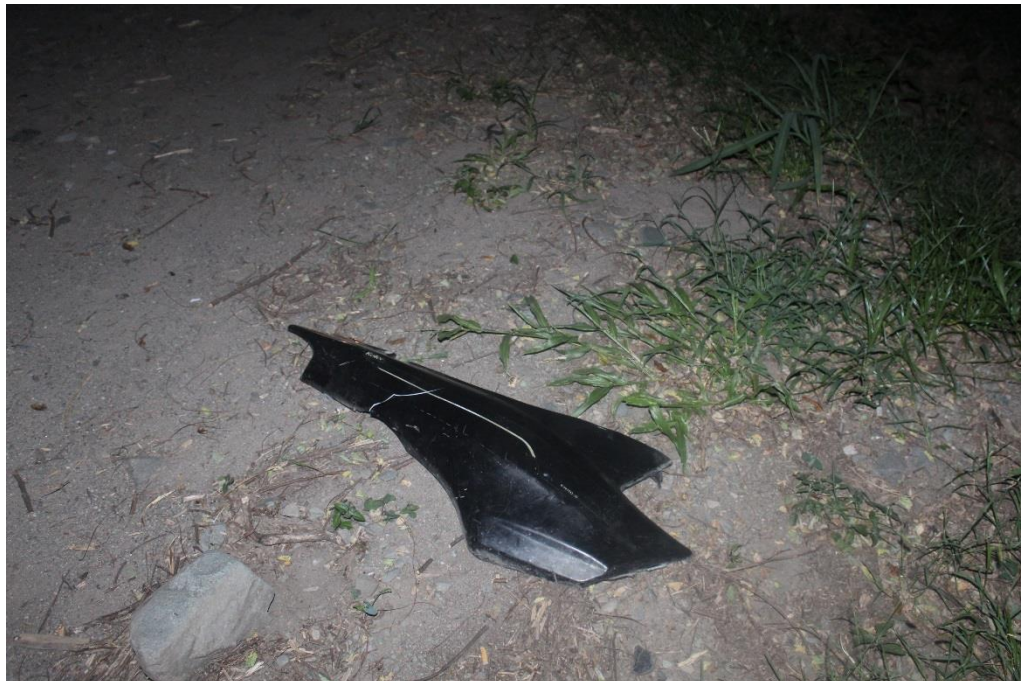
FOTOGRAFIA N° 06: Toma fotográfica realizada con aproximación al fragmento curvo de plástico mencionado en toma anterior.