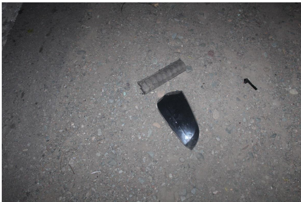
FOTOGRAFIA N° 19: Toma fotográfica realizada con aproximación a la parte de retrovisor mencionada en toma anterior.