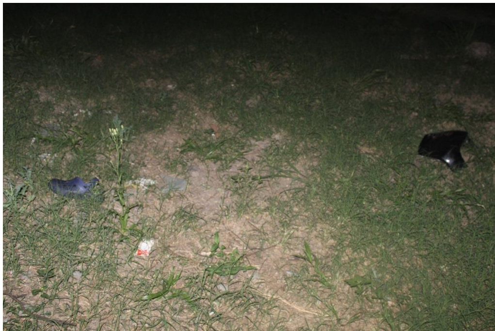
FOTOGRAFIA N° 08: Toma fotográfica realizada en continuidad donde se observa el plástico color oscuro mencionado en Toma Nro 05, y al costado izquierdo un zapato de goma color azul.