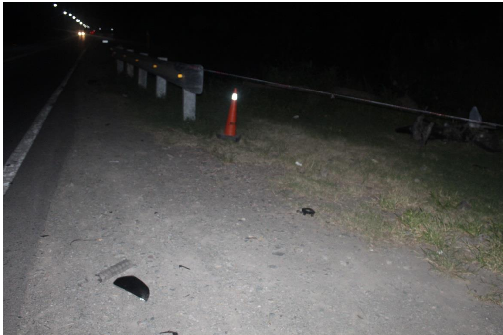
FOTOGRAFIA N° 18: Toma fotográfica realizada sobre la banquina desde el Cardinal Este a Oeste, donde se observa en primer plano una parte de retrovisor, en segundo plano la motocicleta interviniente en el hecho.