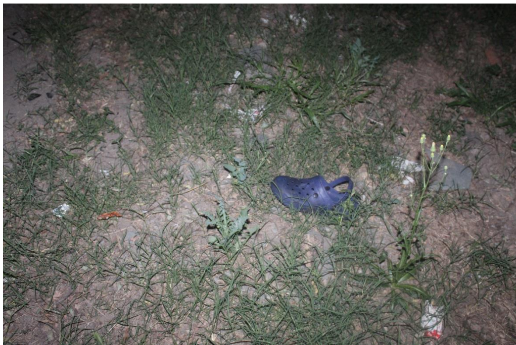
FOTOGRAFIA N° 10: Toma fotográfica realizada al zapato de goma de color oscuro mencionado en Toma Nro 08.