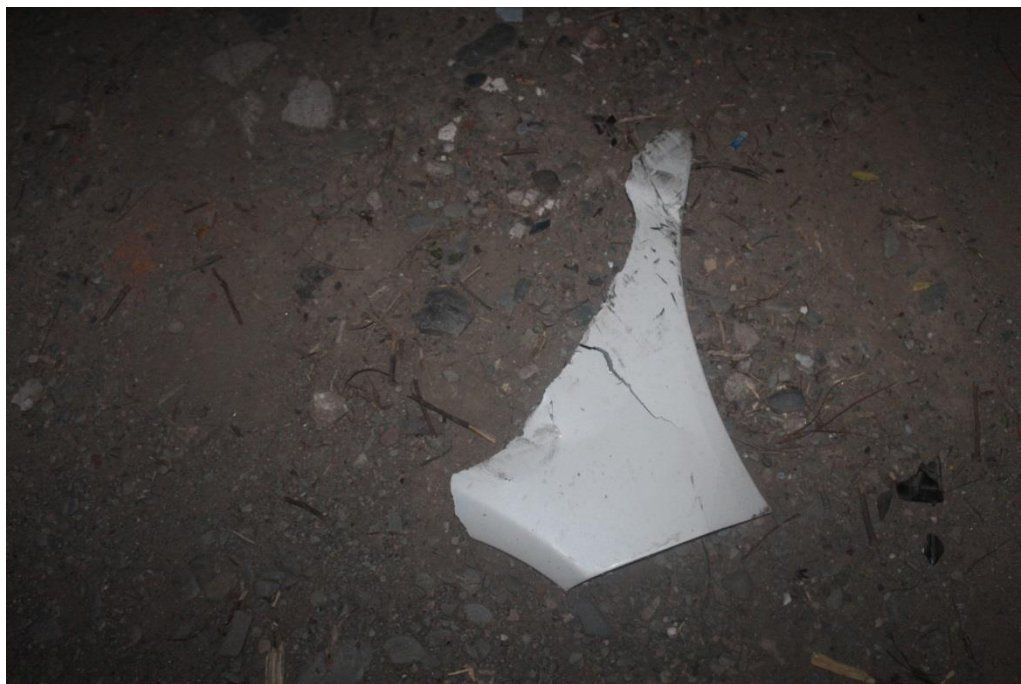
FOTOGRAFIA N° 07: Toma fotográfica realizada con aproximación al trozo de carrocería color blanco mencionado en Toma Nro 5.