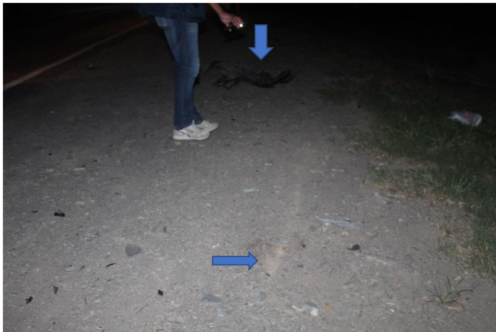
FOTOGRAFIA N° 12: Toma fotográfica realizada con aproximación donde se observa en primer plano derrape sobre la banquina y en segundo plano trozos de plástico color oscuro; ambos indicados con flecha inserta.