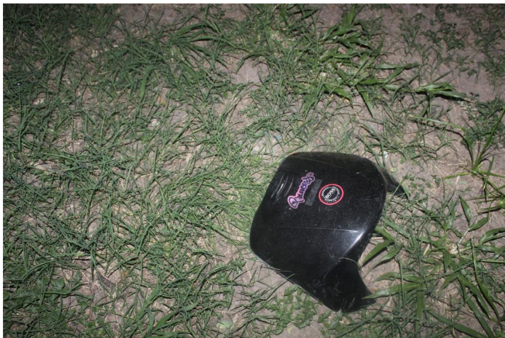
FOTOGRAFIA N° 09: Toma fotográfica realizada con aproximación al plástico color oscuro mencionado en toma anterior.