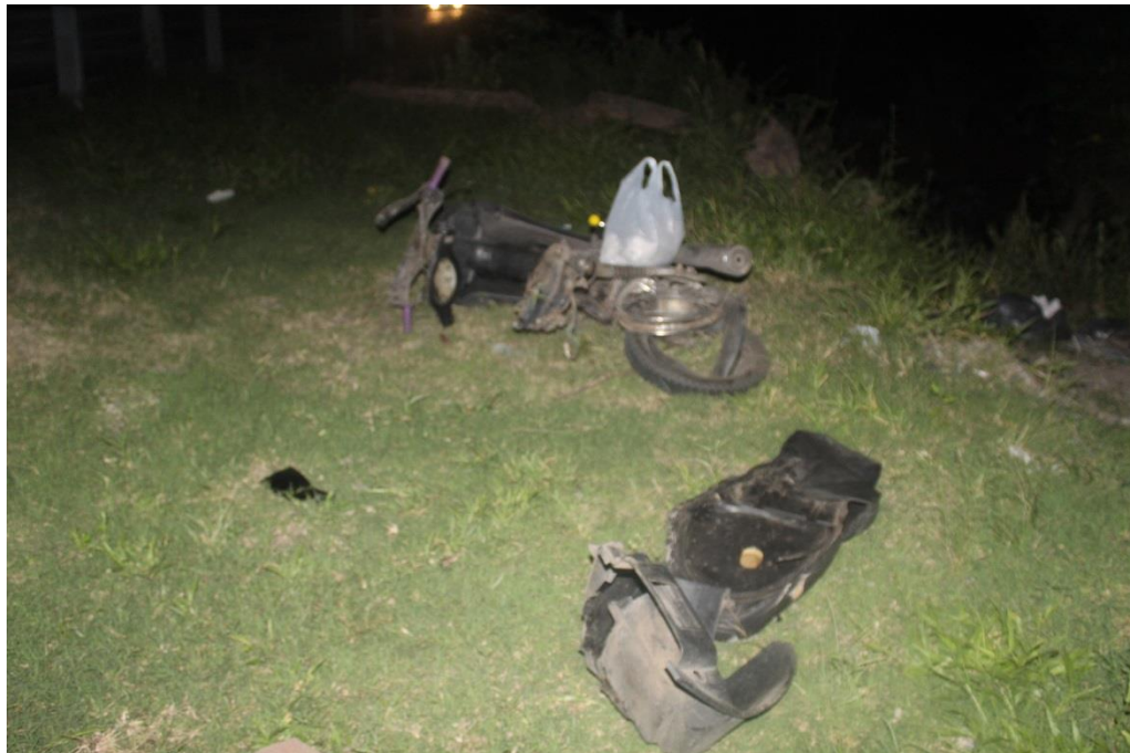
FOTOGRAFIA N° 24: Toma fotográfica realizada desde el Cardinal Este a Oeste al costado de la banquina, donde se observa parte de un asiento de motocicleta y la motocicleta interviniente en el hecho.