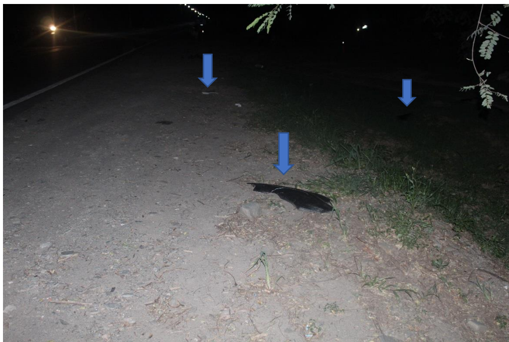
FOTOGRAFIA N° 05: Toma fotográfica realizada sobre la banquina desde el Cardinal Este a Oeste, donde se observa en primer plano un fragmento curvo de plástico color oscuro, en segundo plano un trozo de carrocería color blanco y un plástico oscuro con stiker color rosa , indicados con flecha inserta.