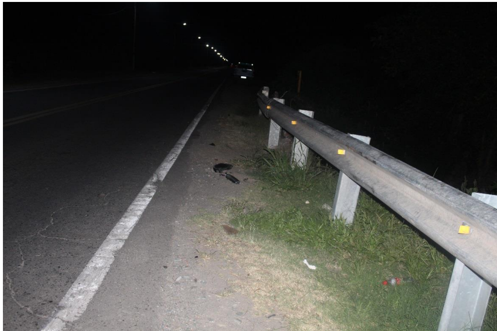
FOTOGRAFIA N° 20: Toma fotográfica realizada en continuidad sobre la banquina desde el Cardinal Este a Oeste, donde se observa sobre el puente partes de retrovisor.