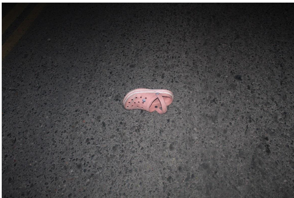
FOTOGRAFIA N° 03: Toma fotográfica realizada con aproximación al calzado de goma mencionado en Toma Nro 1.