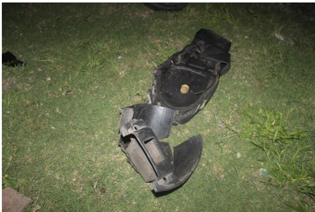
FOTOGRAFIA N° 25: Toma fotográfica con aproximación al asiento de la motocicleta mencionado en toma anterior. banquina