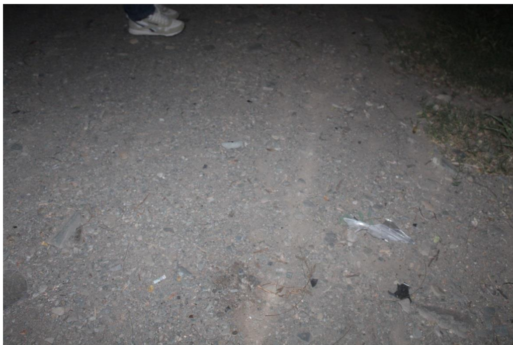
FOTOGRAFIA N° 13: Toma fotográfica realizada con aproximación al derrape mencionado en toma anterior.