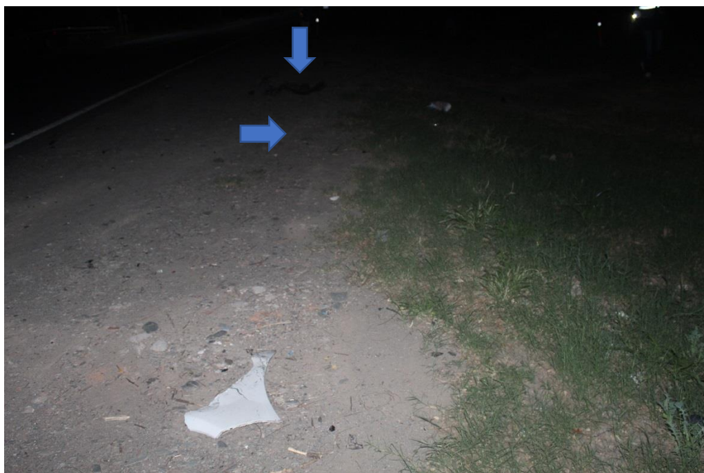
FOTOGRAFIA N° 11: Toma fotográfica realizada sobre la banquina donde se observa en primer plano el trozo de carrocería color blanco mencionado en Toma Nro 5, en segundo plano acrílicos dispersos e indicado con flecha inserta derrape sobre la banquina y trozos de plástico color oscuro.