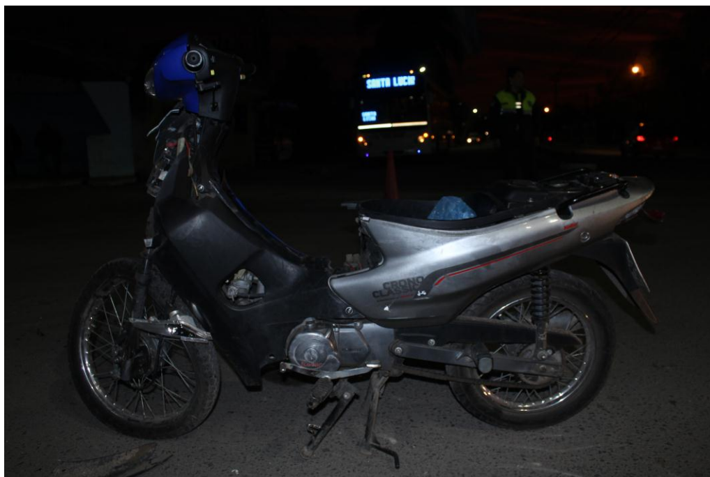
FOTOGRAFIA N° 11: Se observa el lateral izquierdo y su estado.-