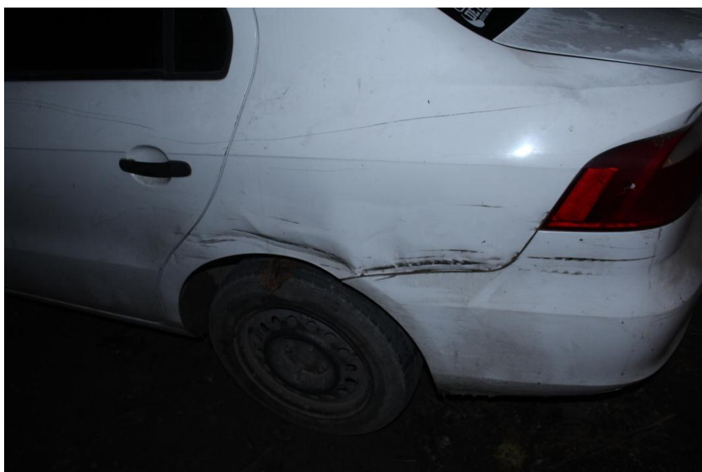
FOTOGRAFIA N° 17: Realizada con aproximación a los daños.-