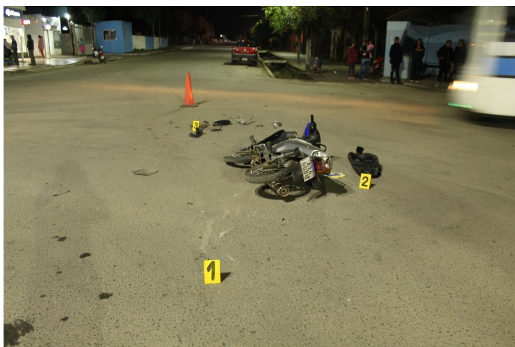
FOTOGRAFIA N° 03: Realizada con desplazamiento del suscriptor hacía el cardinal Oeste se observa en primer plano el indicio 1 indicado raspado, con cartel 2 uno de los vehículos intervinientes y restos de moto partes, a continuación con cartel 3 se observa restos plásticos y tierra dispersa. -