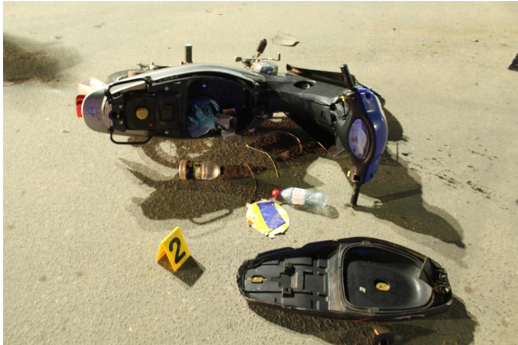
FOTOGRAFIA N° 06: Se observa desde otro ángulo el indicio 2, como así también unas botellas con liquido transparente. -