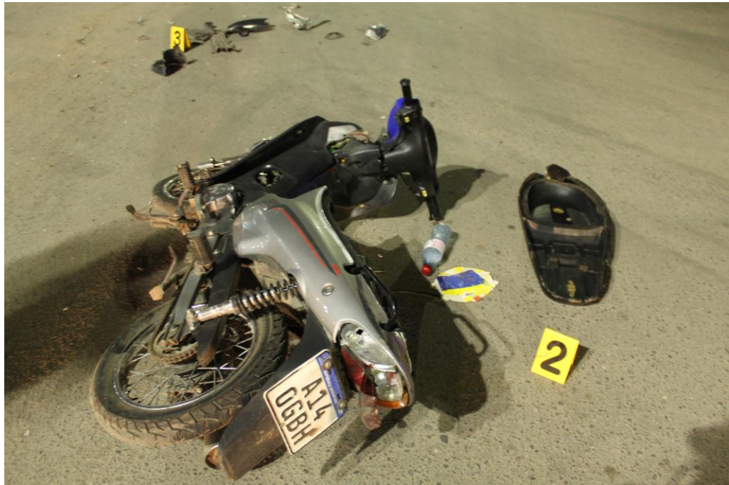
FOTOGRAFIA N° 05: Se observa con aproximación el indicio 2.-