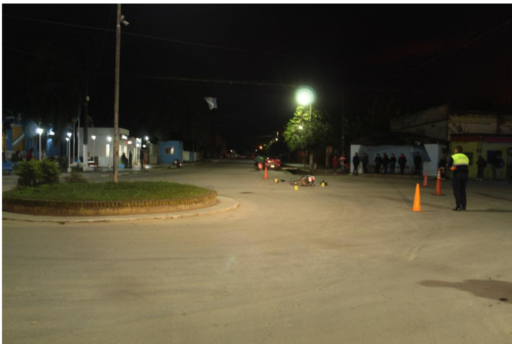
FOTOGRAFIA N° 02: Toma realizada de forma panorámica, se observa desde otro angulo el lugar donde se ehabrian producido los hechos. Angulo fotografico de Este a Oeste.-