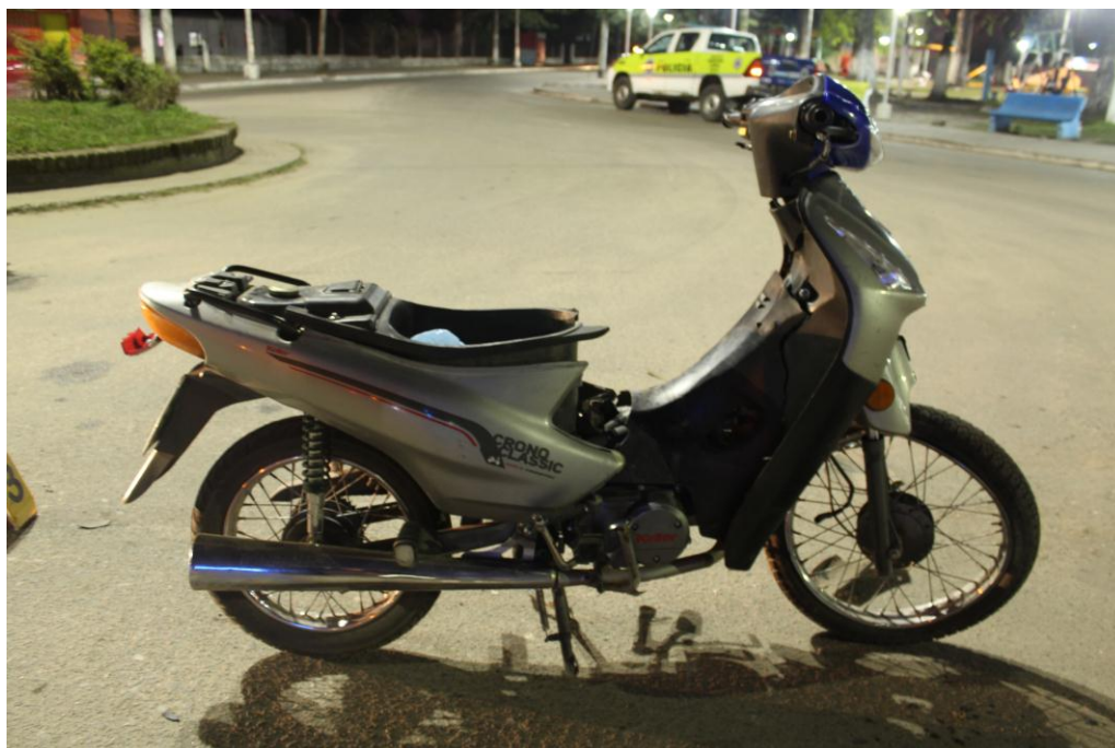
FOTOGRAFIA N° 09: Se observa el lateral derecho y su estado. -