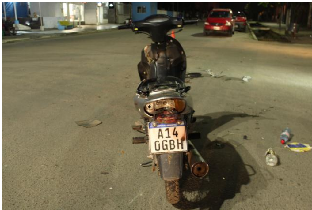
FOTOGRAFIA N° 10: Se observa la parte trasera y su estado.-