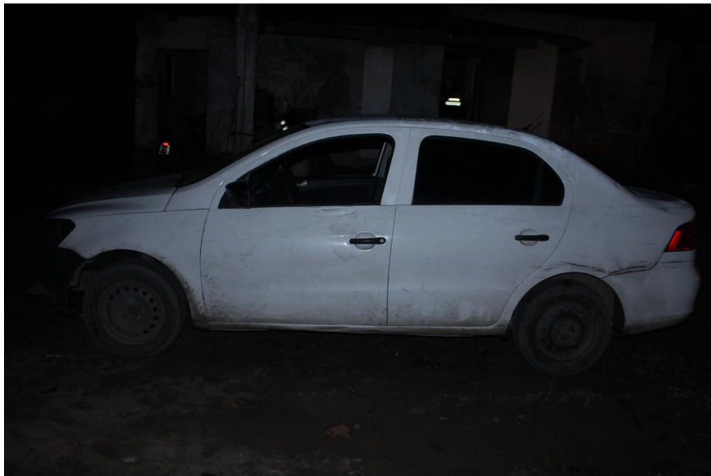
FOTOGRAFIA N° 16: Se observa el lateral derecho y su estado.-