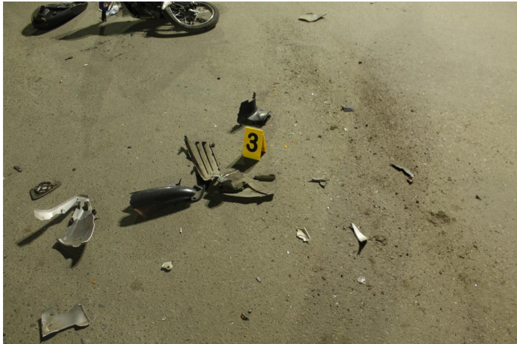
FOTOGRAFIA N° 07: Realizada con aproximación al indicio 3. Angulo fotográfico de Oeste a Este. -