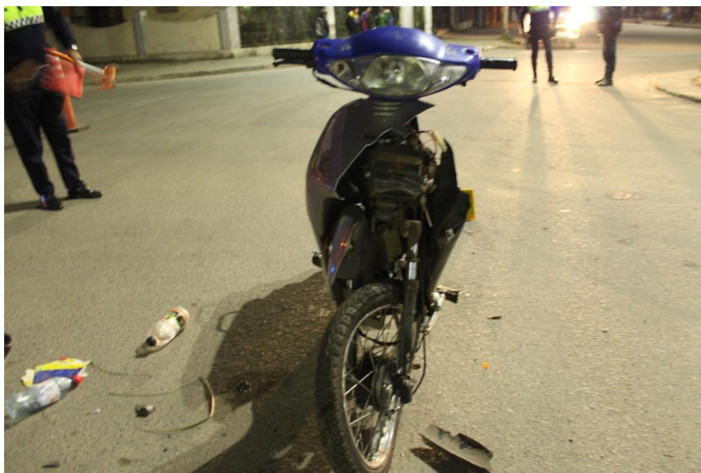
FOTOGRAFIA N° 08: Toma realizada a la parte delantera de la motocicleta marca Keller Crono Classic, dominio A40GBH. -