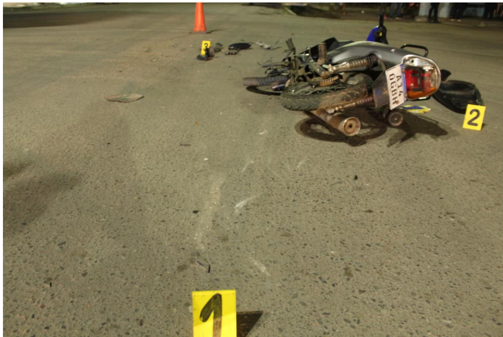
FOTOGRAFIA N° 04: Se observa con aproximación el raspado y a posterior se observa los indicios antes mencionados. -