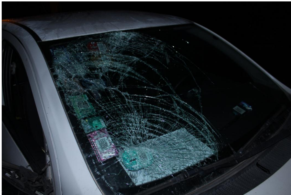
FOTOGRAFIA N° 14