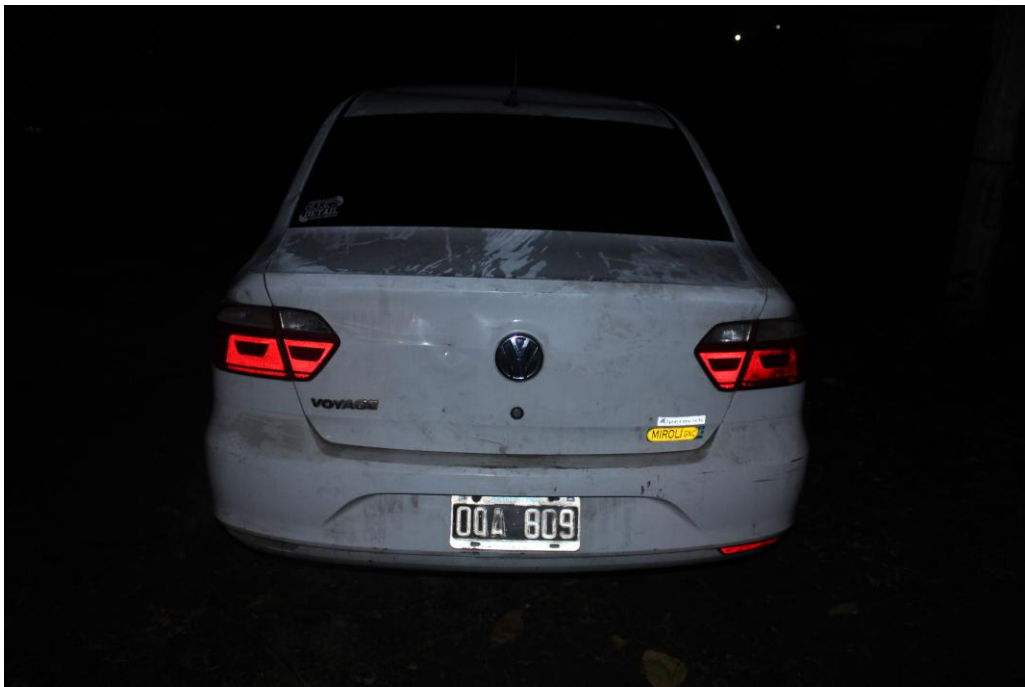
FOTOGRAFIA N° 18: Se observa la parte trasera y su estado.-