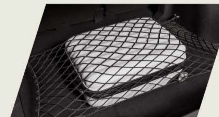
RED ELÁSTICA PARA BAUL