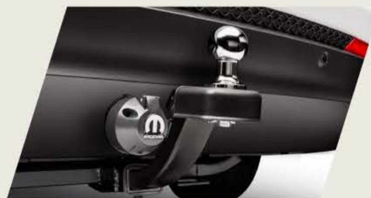
GANCHO DE REMOLQUE