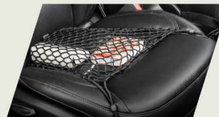
RED ELÁSTICA DE ASIENTO DELANTERO