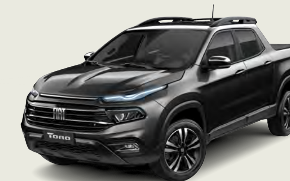
852 - Negro Carbón