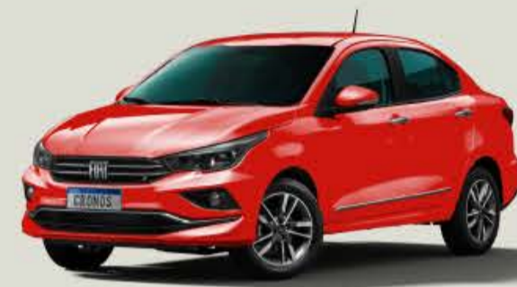
978 - Rojo Montecarlo