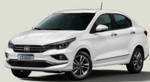
249 - Blanco Banchisa