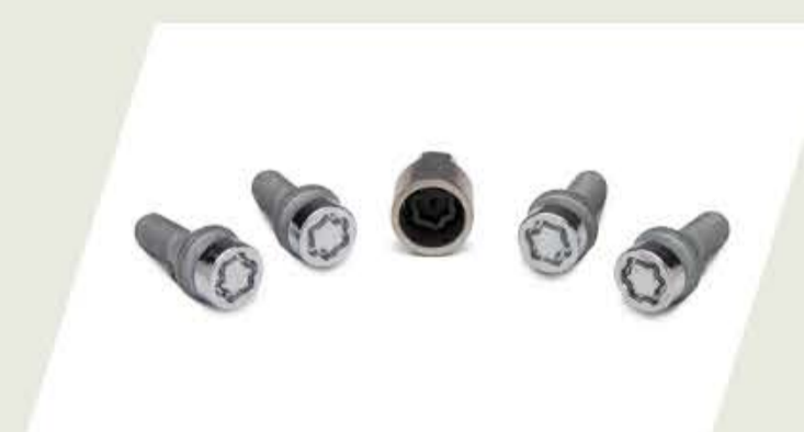
JUEGO DE TORNILLOS ANTIROBOS PARA RUEDA