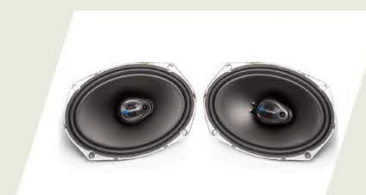
KIT PARLANTES TRASEROS