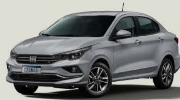
619 - Plata Bari