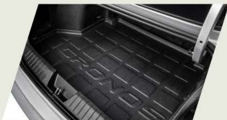
ALFOMBRA BAUL ANTIDERRAME