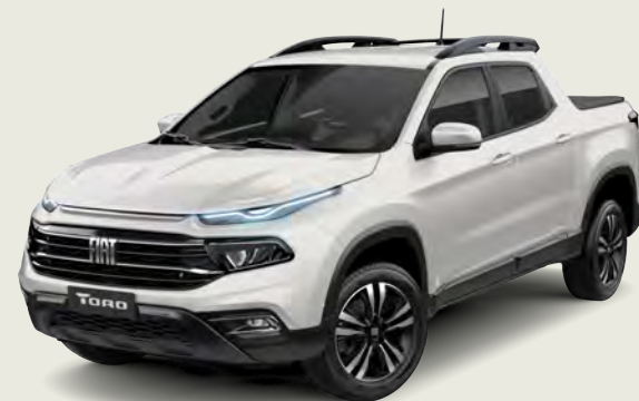
296 - Blanco Ambiente