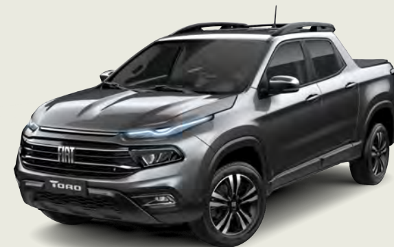
847 - Gris Granito