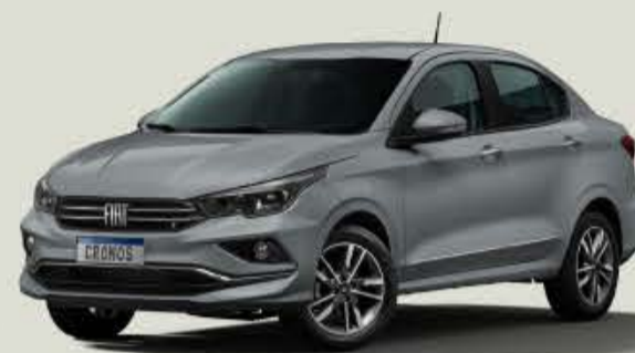
540 - Gris Strato