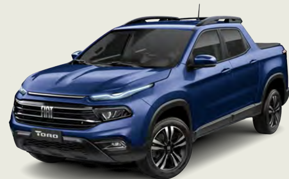
345 - Azul Jazz