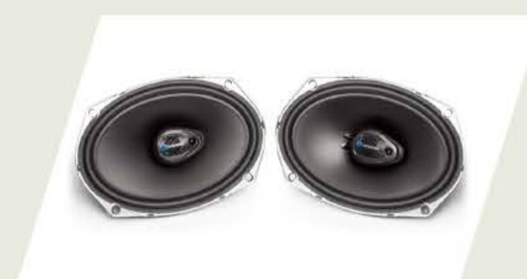
KIT PARLANTES DELANTEROS