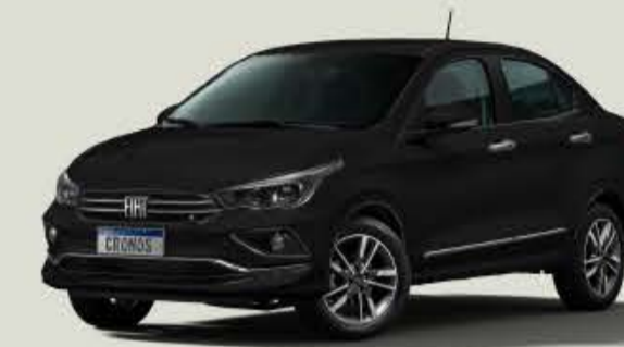
806 - Negro Vulcano