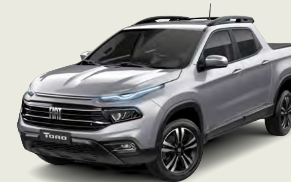
097 - Gris Billet