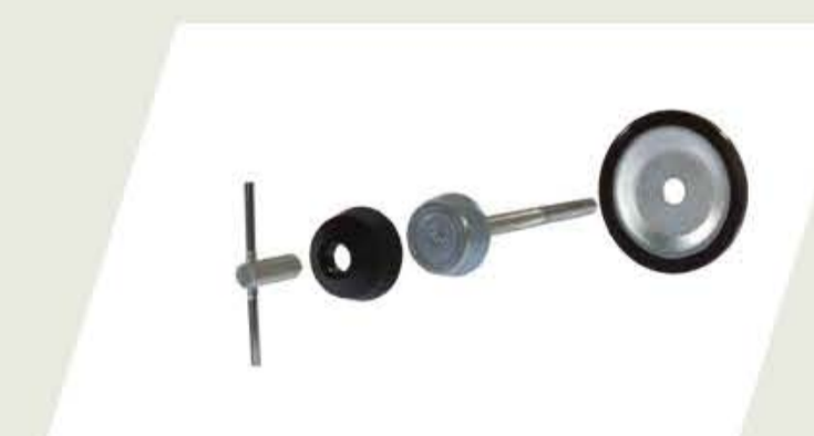
BULÓN DE SEGURIDAD PARA RUEDA DE AUXILIO