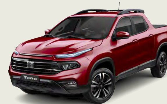
809 - Rojo Tribal