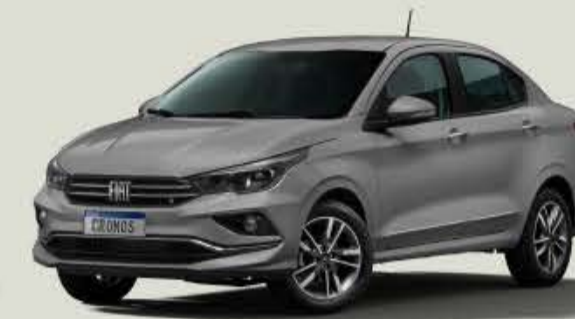
692 - Gris Silverstone