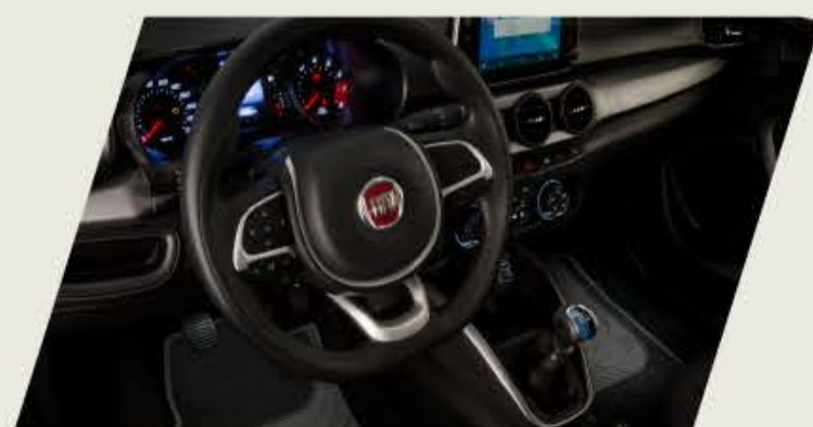
KIT ILUMINACION INTERIOR