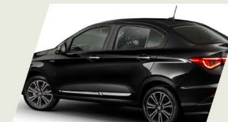
MOLDURA DE PUERTA CROMADA