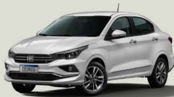
534 - Blanco Alaska