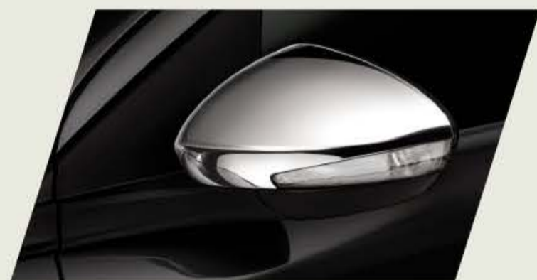
TAPA ESPEJO RETROVISOR EXTERNO CROMADO

Acercate a un concesionario y conocé la gama de accesorios originales que mopar te ofrece para equipar tu fiat Cronos, seguido de las imágenes de cada accesorio.