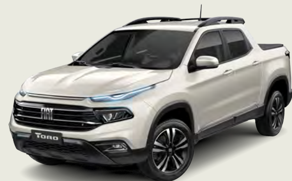
742 - Blanco Polar