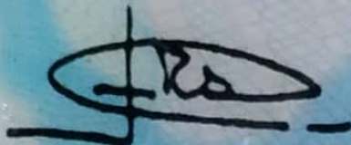
Cr. A. Florencio Randazzo Ministro del Interior