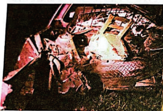
FOTOGRAFIA DIGITAL N° 28