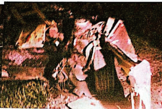
FOTOGRAFIA DIGITAL N° 29