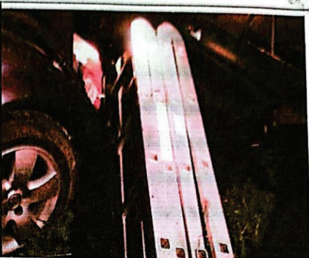
FOTOGRAFIA DGITAL N° 24

Se observa en el interior de vehículo abajo del asiento del acompañante frascos de espumas, así también se observan en el asiento trasero derecho una escalera de aluminio con una parte caída hacia la banquina.