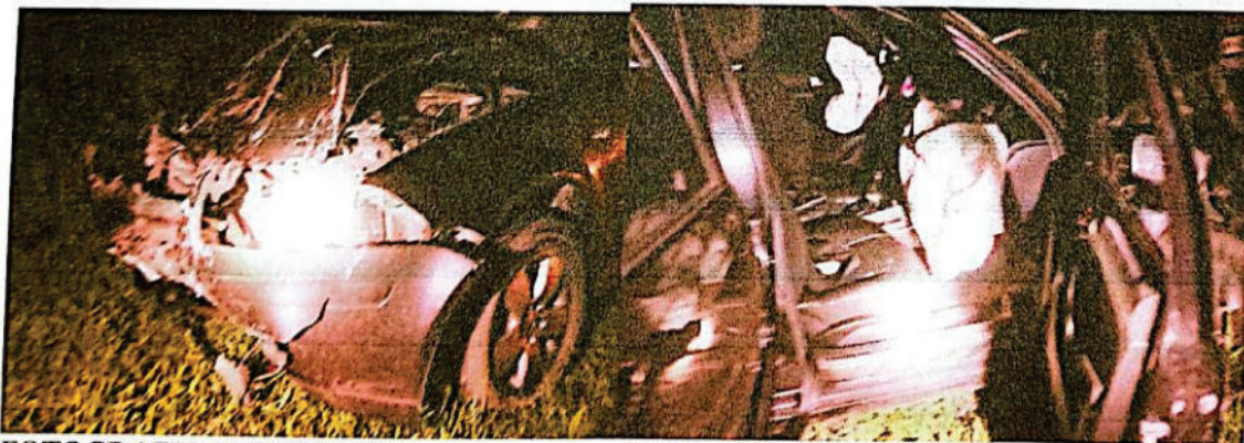
FOTOGRAFIA DIGITAL N° 21