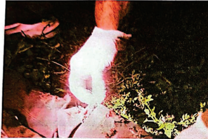
FOTOGRAFIA DIGITAL N° 15

Se observa en fotografías N° 13,14 y 15 fractura expuesta en ambas piernas del menor así también se observan heridas en la espalda.