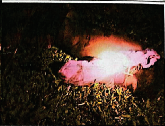
FOTOGRAFIA DGITAL N° 11