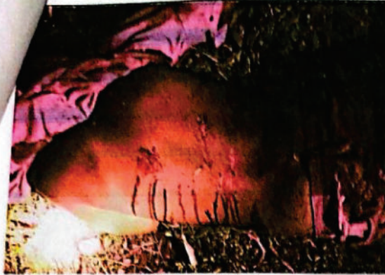
FOTOGRAFIA DIGITAL N° 13