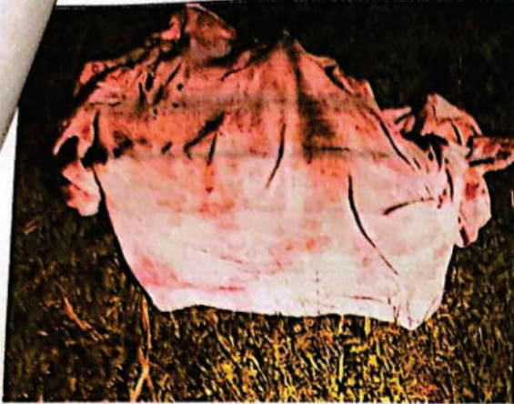
FOTOGRAFIA DGITAL N° 10