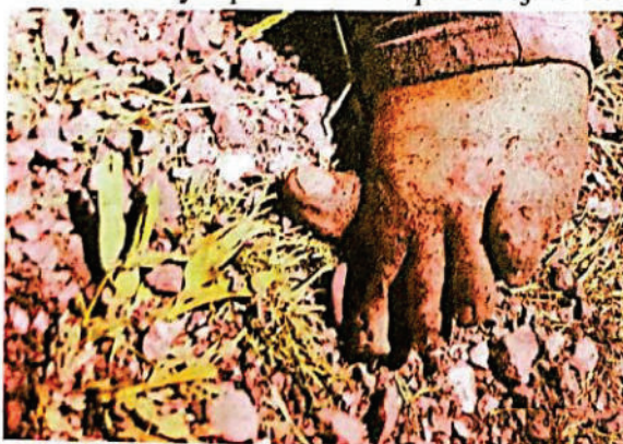
FOTOGRAFIA DGITAL N° 08

Se observa en las fotografías N°05,06 y 07 el cuerpo del c/ que en vida se llamara Ruiz Rafael este se encuentra en banquina oeste de la runa nacional N° 34 observándose heridas en cada lado derecho y liquido de color pardo rojizo en el oído izquierdo