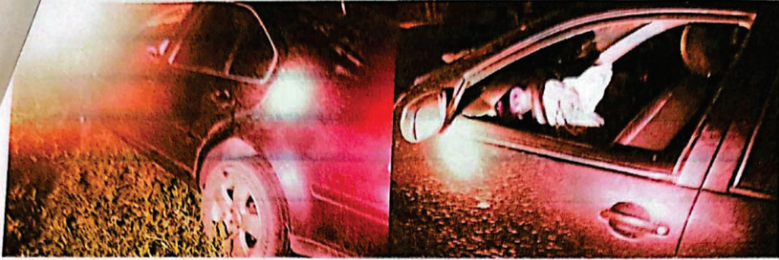
FOTOGRAFIA DIGITAL N° 17