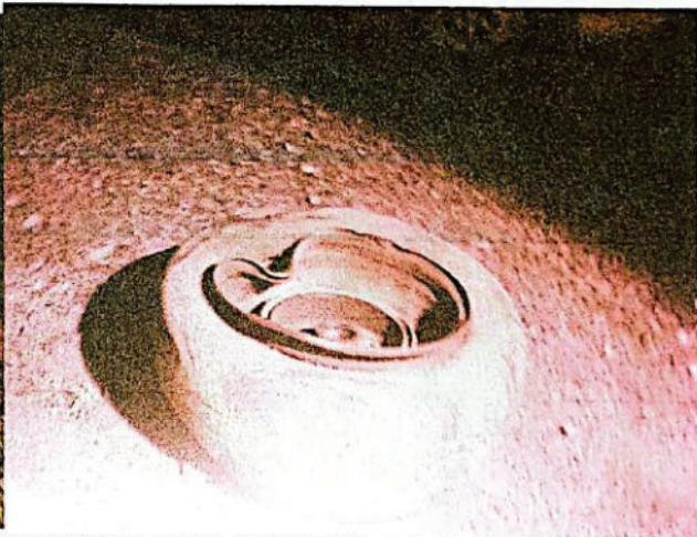
FOTOGRAFIA DGITAL N° 26

Se observa en las fotografías N° 25 Y 26 un capot de color bordo en la banquina oeste de la ruta nacional así también se observa una rueda a una distancia de 28cm de la línea blanca de la ruta nacional N34.