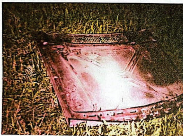
FOTOGRAFIA DGITAL N° 25

Se observa en el interior de vehículo abajo del asiento del acompañante frascos de espumas, así también se observan en el asiento trasero derecho una escalera de aluminio con una parte caída hacia la banquina.