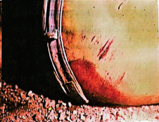
FOTOGRAFIA DGITAL N° 06