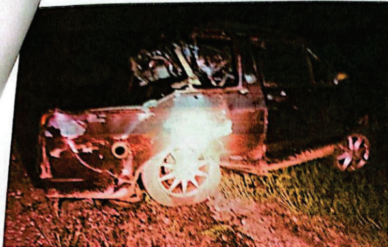
FOTOGRAFIA DIGITAL N° 27