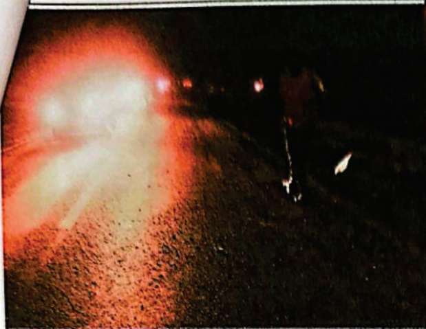
FOTOGRAFIA DGITAL N° 02