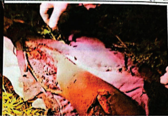
FOTOGRAFIA DIGITAL N° 14