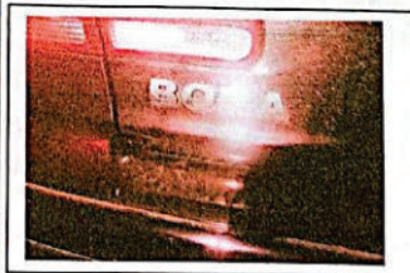
FOTOGRAFIA DIGITAL N° 16

Se observa en la fotografía digital N° 16 la parte trasera de un automóvil de color negro marca Volkswagen modelo Bora dominio colocado IUH175 , este se encuentra con frente hacia el punto cardinal sur en su recorrido final en banquina oeste de la ruta nacional 34 a unos 4.6m de la cinta asfáltica de dicha ruta.