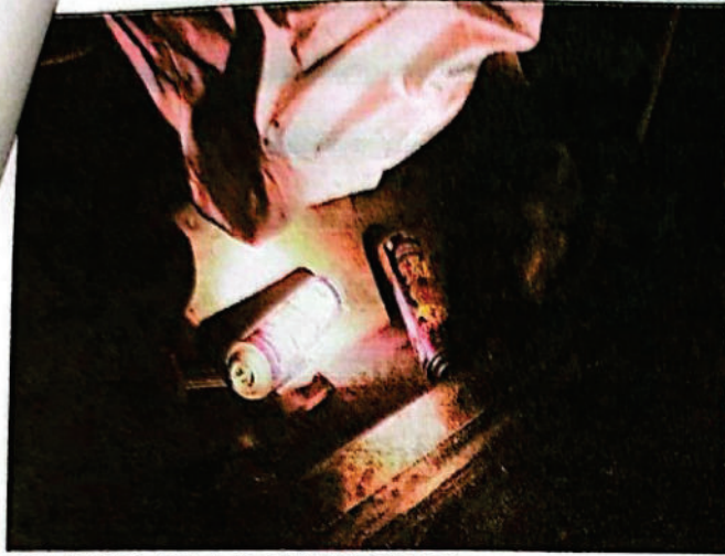
FOTOGRAFIA DGITAL N° 23