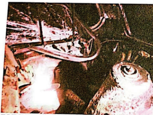
FOTOGRAFIA DIGITAL N° 30