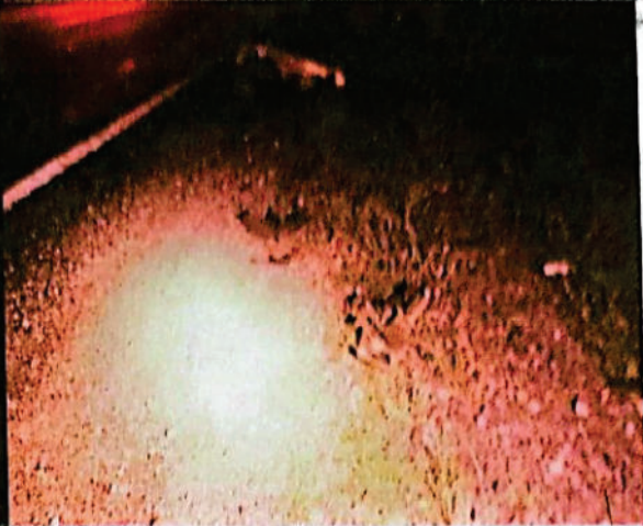
FOTOGRAFIA DGITAL N° 03