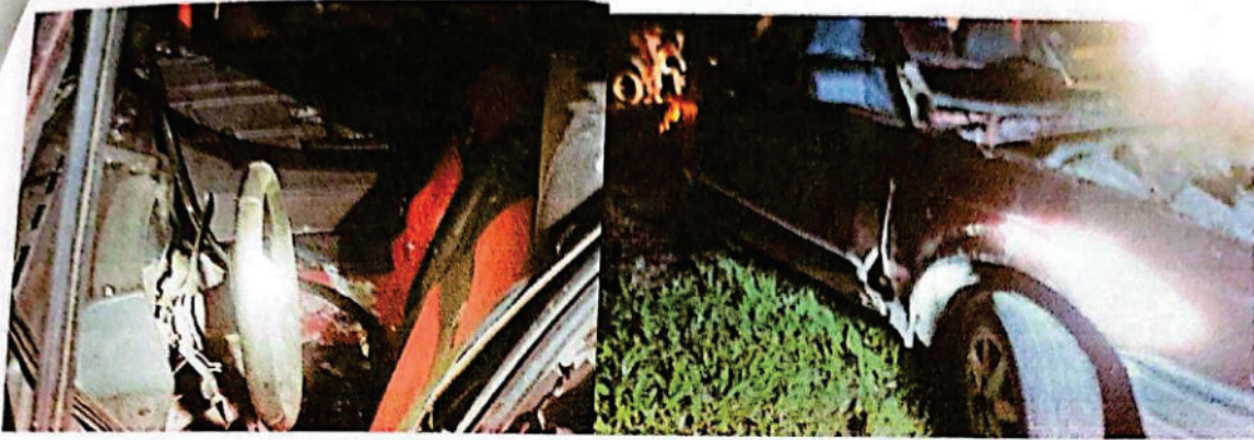
FOTOGRAFIA DGITAL N° 32