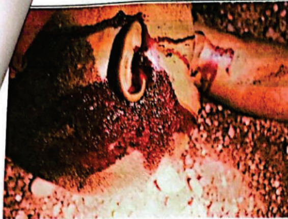
FOTOGRAFIA DGITAL N° 05