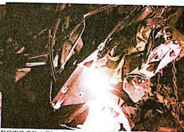
FOTOGRAFIA DIGITAL N° 31

Se observa en las fotografías N° 27,28 , 29, 30 y 31 el recorrido final de una camioneta de color bordo en la banquina oeste de la ruta nacional N° 34 a una distancia de 3.5m de la cinta asfáltica y a una distancia de 55m desde el lugar de impacto, en lo que habría sido la caja de carga de la camioneta se observa una silla de madera con manchas de color pardo rojiza, observándose dicho vehículo con daños en su totalidad.