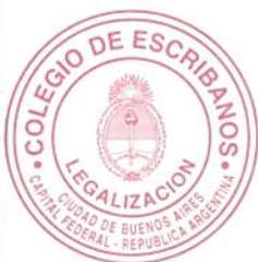
ESC. OLGA BEATRIZ VINOGRADSKI COLEGIO DE ESCRIBANOS LEGALIZADORA