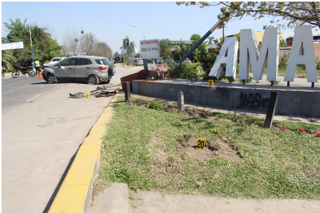
FOTOGRAFIA N° 55: Vista panorámica donde se observa la ubicación de los indicios señalados con los carteles N° 20, 1 y 2.