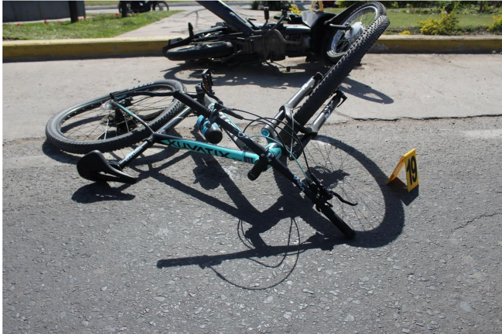
FOTOGRAFIA N° 54: Vista superior de la bicicleta, se aprecia su ubicación final.