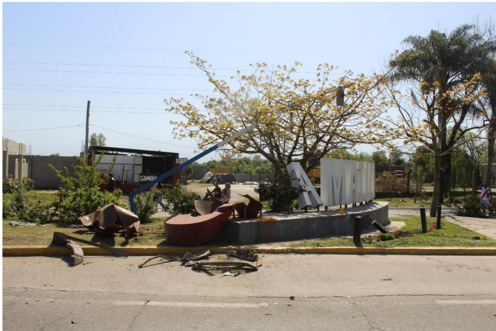
FOTOGRAFIA N° 61: Vista panorámica tomada desde el centro de la calzada donde se observan daños en cartel de ingreso a la Ciudad de Famailla, ubicado en el margen Oeste, y daños visibles en la columna de iluminación.