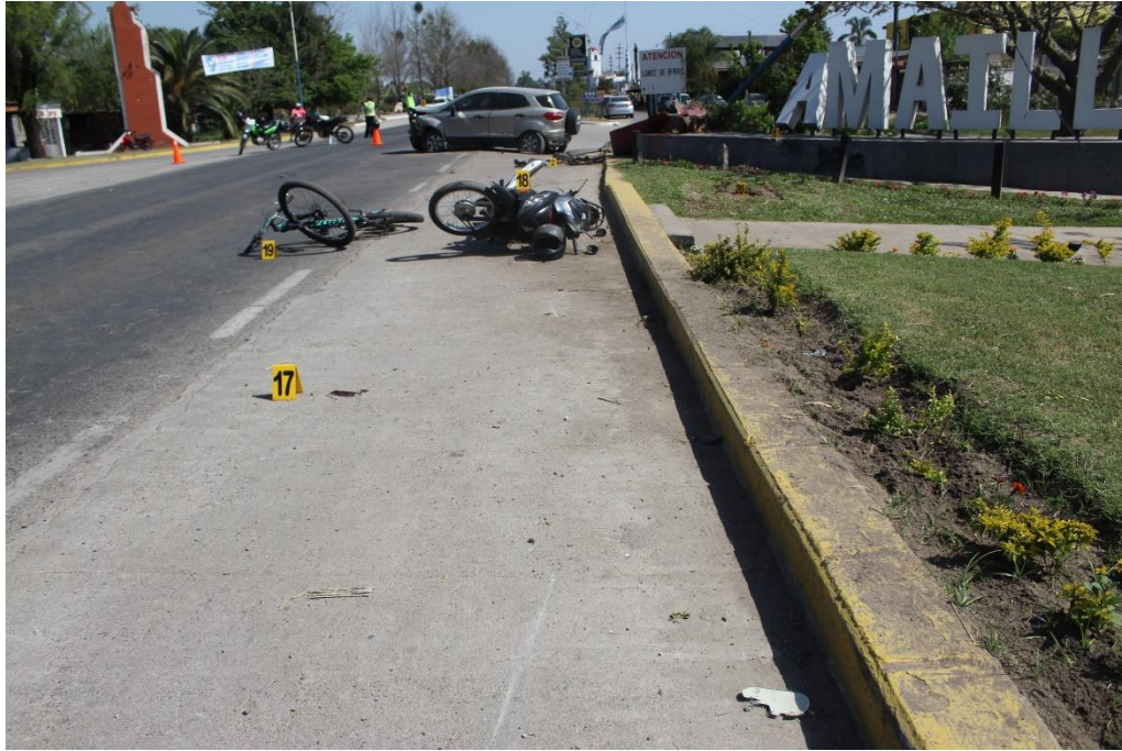
FOTOGRAFIA N° 44: Toma panorámica donde se observan la ubicación de los indicios posteriores, señalados con los carteles N° 17, 18 y 19.