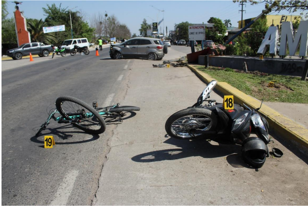
FOTOGRAFIA N° 46: Toma en aproximación donde se observa una motocicleta de color negro ubicada sobre su lateral izquierdo en la banquina asfaltada (indicador N° 18) y una bicicleta sobre el carril con sentido de circulación Norte–Sur, específicamente sobre la línea discontinua que delimita la banquina