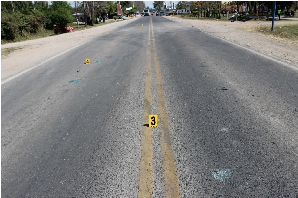
FOTOGRAFIA N° 9: Panorámica realizada desde el centro de la calzada (doble línea amarilla), donde se observa una huella de fricción neumática señalada con el cartel N° 3. En segundo plano se aprecia el cartel N° 4 indicando fragmentos de vidrios sobre el carril Sur-Norte.