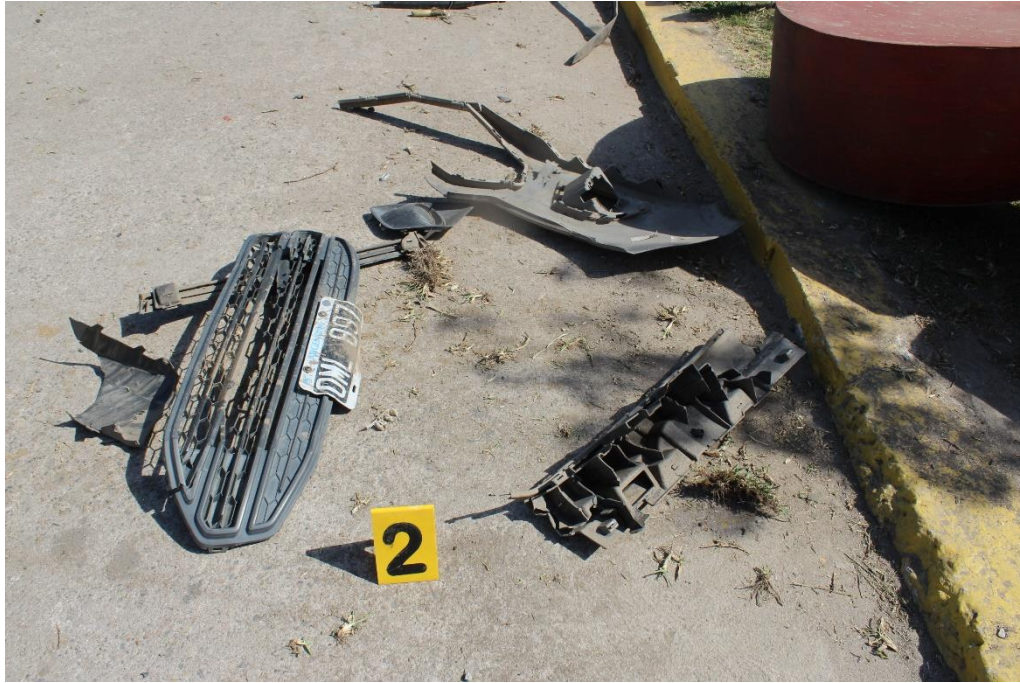
FOTOGRAFIA N° 60: Detalle de restos de autopartes ubicados sobre la banquina asfaltada.