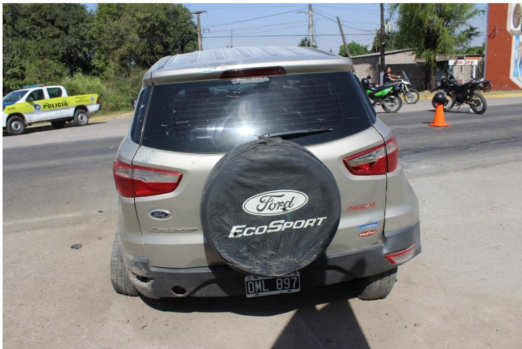
FOTOGRAFIA N° 65: Vista posterior de la camioneta marca Ford, modelo Ecosport, dominio OML 897, donde se aprecia su posición y estado.