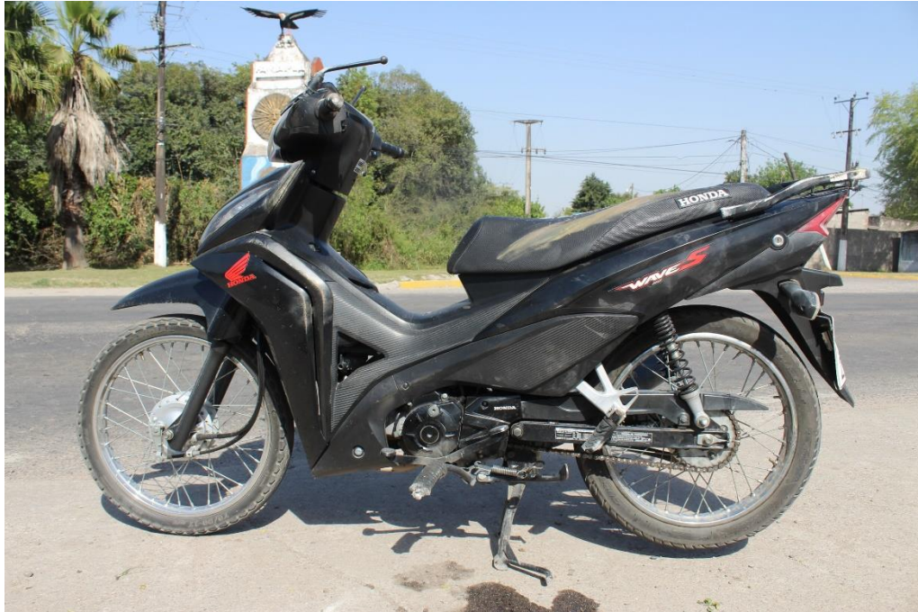
FOTOGRAFIA N° 70: Detalle de motocicleta marca Honda, modelo Wave, color negro, observándose su lateral izquierdo y el estado de conservación.