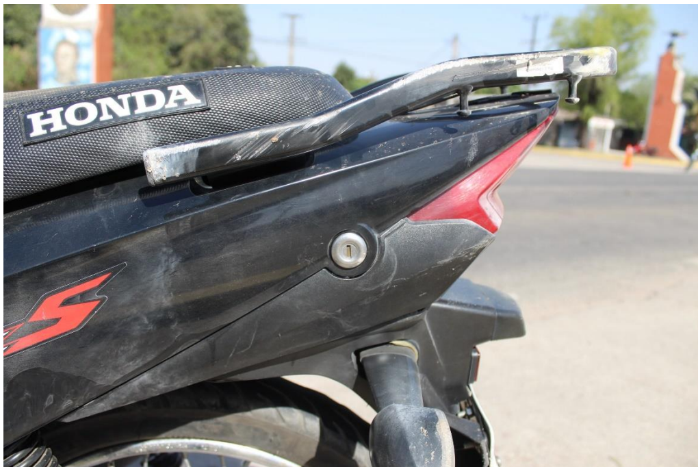
FOTOGRAFIA N° 75: Detalle del lateral derecho de la motocicleta, donde se aprecia la cerradura del compartimiento del asiento.