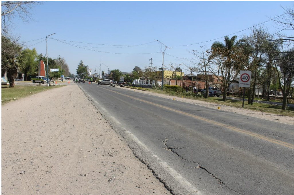
FOTOGRAFIA N° 31: Toma panorámica desde la banquina Sur-Norte, donde se observa la calzada completa y la ubicación de los indicios posteriores.