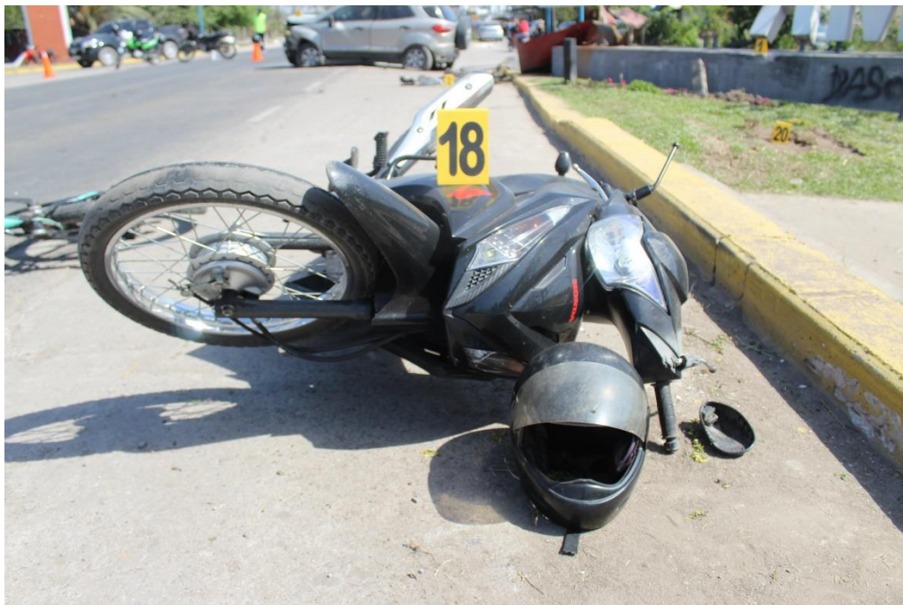
FOTOGRAFIA N° 47: Detalle de la motocicleta señalada con el cartel N° 18, donde se aprecia su ubicación, posición final y estado general. Se observa un casco apoyado a un costado y espejos retrovisores de la misma.