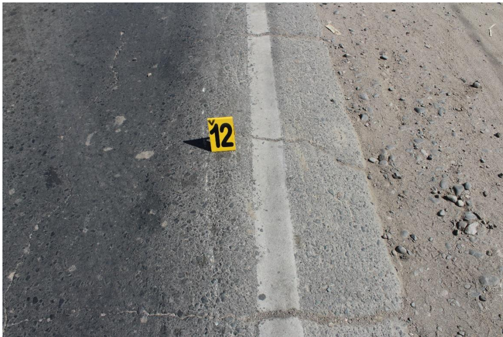
FOTOGRAFIA N° 35: Detalle de la huella de fricción metálica sobre el carril.