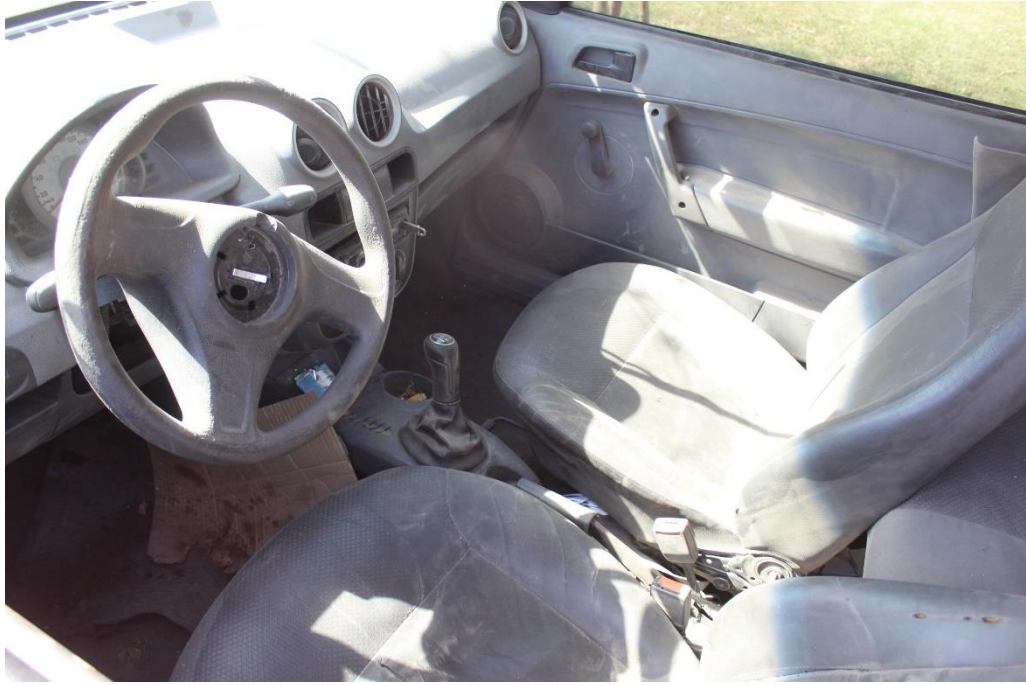
FOTOGRAFIA N° 30: Detalle del interior del habitáculo del vehículo.