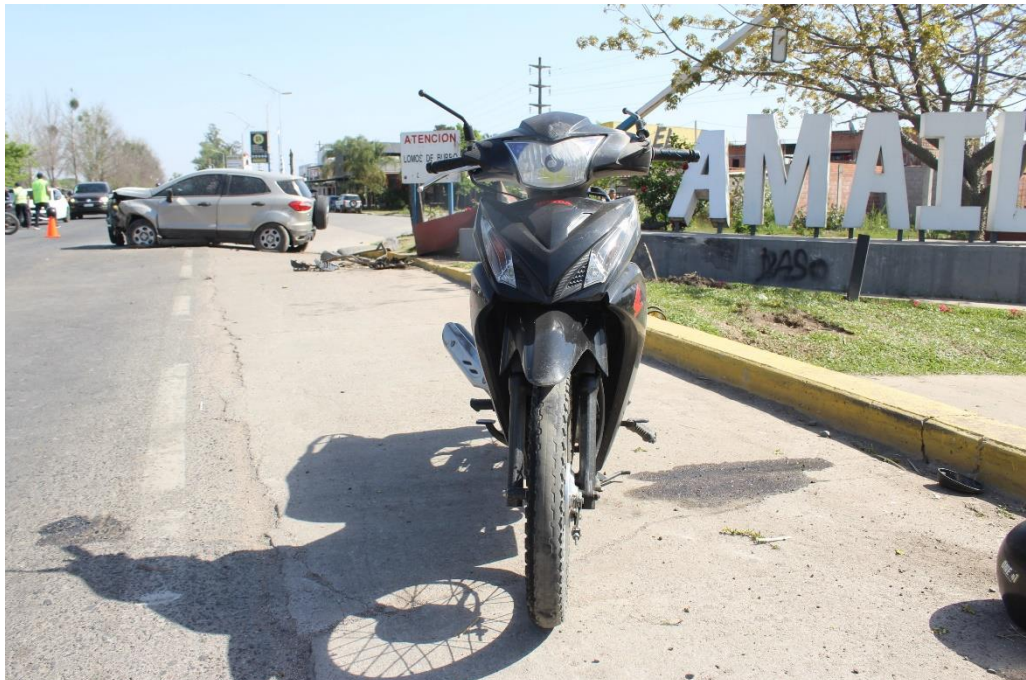
FOTOGRAFIA N° 73: Vista frontal de la motocicleta, se aprecian los daños visibles en su estructura.