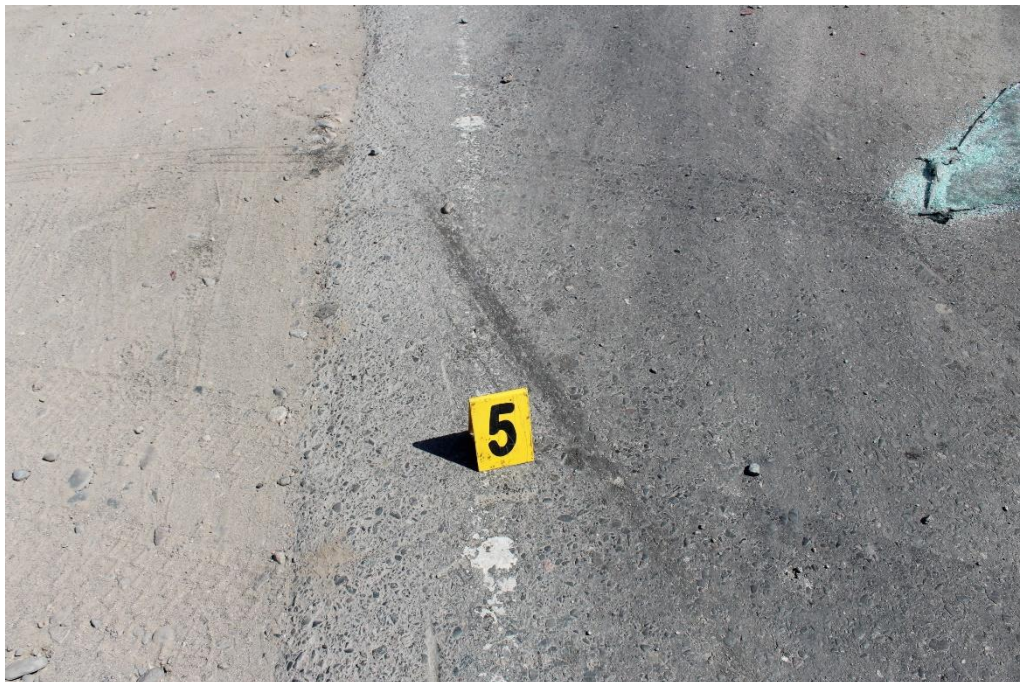
FOTOGRAFIA N° 15: Detalle de la huella de fricción neumática sobre la calzada con prolongación hacia la banquina de tierra compacta.