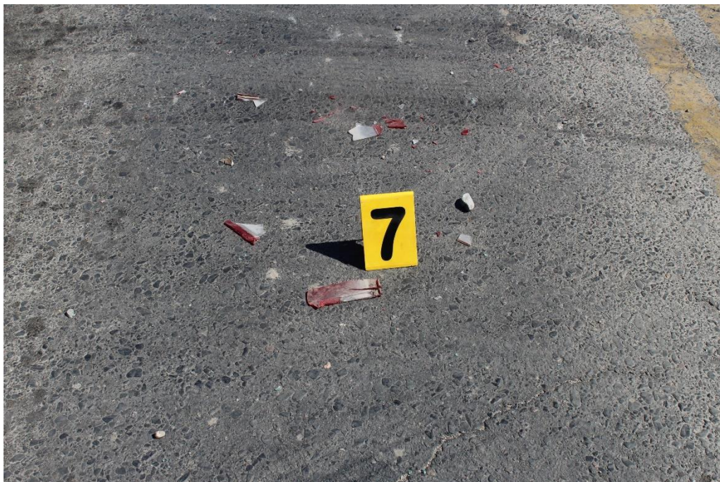
FOTOGRAFIA N° 17: Detalle del indicio señalado con el cartel N° 7, correspondiente a restos de autopartes sobre la calzada.