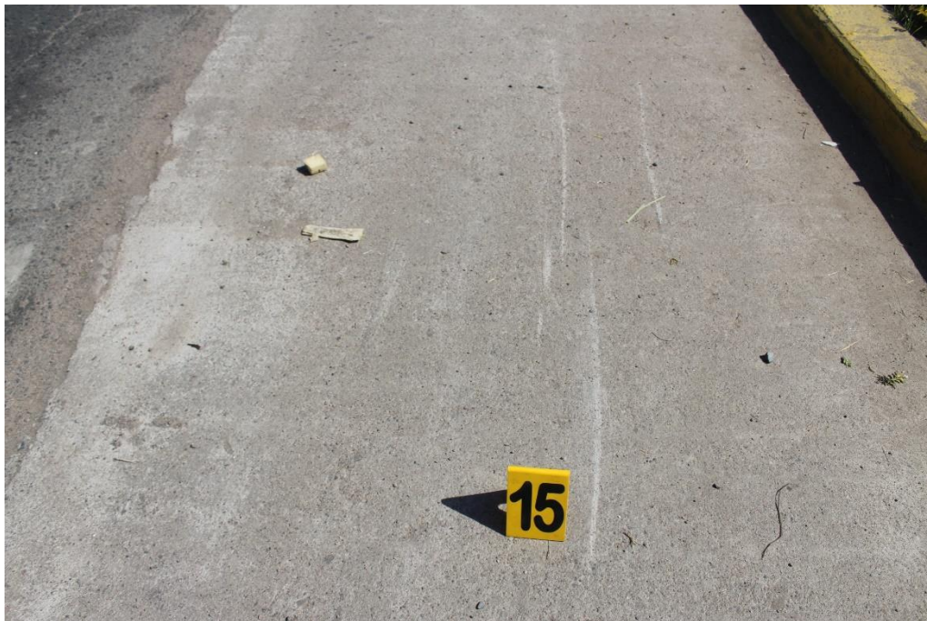
FOTOGRAFIA N° 41: Detalle de huellas de fricción metálica sobre la banquina asfaltada con sentido de circulación Norte-Sur. Indicado con el cartel N°15.