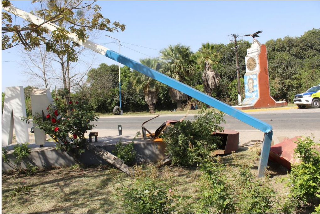
FOTOGRAFIA N° 62: Toma desde un ángulo distinto que permite observar con mayor detalle el daño estructural en la columna de iluminación artificial.