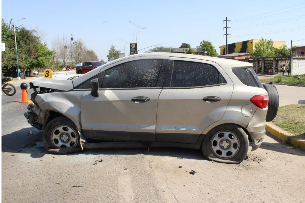
FOTOGRAFIA N°64: Detalle del lateral izquierdo de la camioneta color gris, señalada con el cartel N° 3, donde se observa su ubicación y estado general.