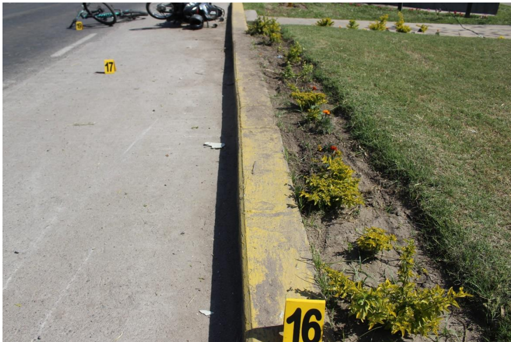
FOTOGRAFIA N° 43: Toma en aproximación inicio de la huella de efracción sobre el cordón, observándose la dirección y trayectoria de la misma.