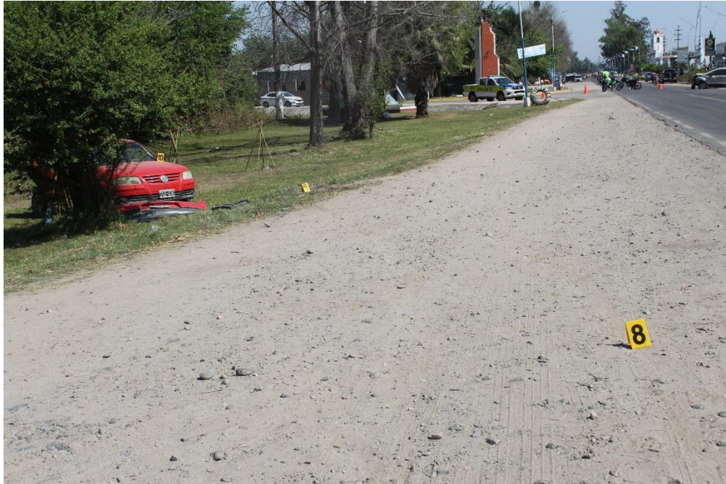
FOTOGRAFIA N° 18: Toma realizada desde la calzada Sur-Norte, donde se observa el cartel indicador N° 8 señalando la prolongación de la huella de fricción neumática indicada previamente con el cartel N° 5.