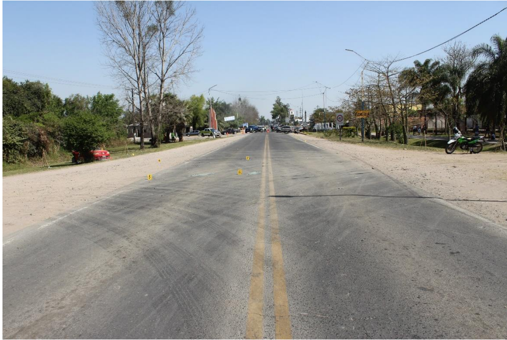
FOTOGRAFIA N° 12: Toma panorámica en aproximación donde se observa, sobre el carril Sur-Norte, el cartel N° 6 señalando restos de vidrios; el cartel N° 5 indicando huella de fricción neumática sobre la línea blanca de delimitación del carril y, en segundo plano, el cartel N° 7.