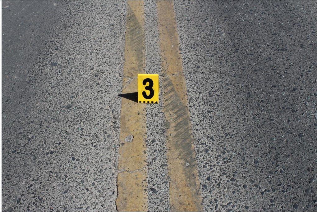
FOTOGRAFIA N° 10: Detalle del indicio señalado con el cartel N° 3, correspondiente a una huella de fricción neumática sobre la doble línea amarilla.