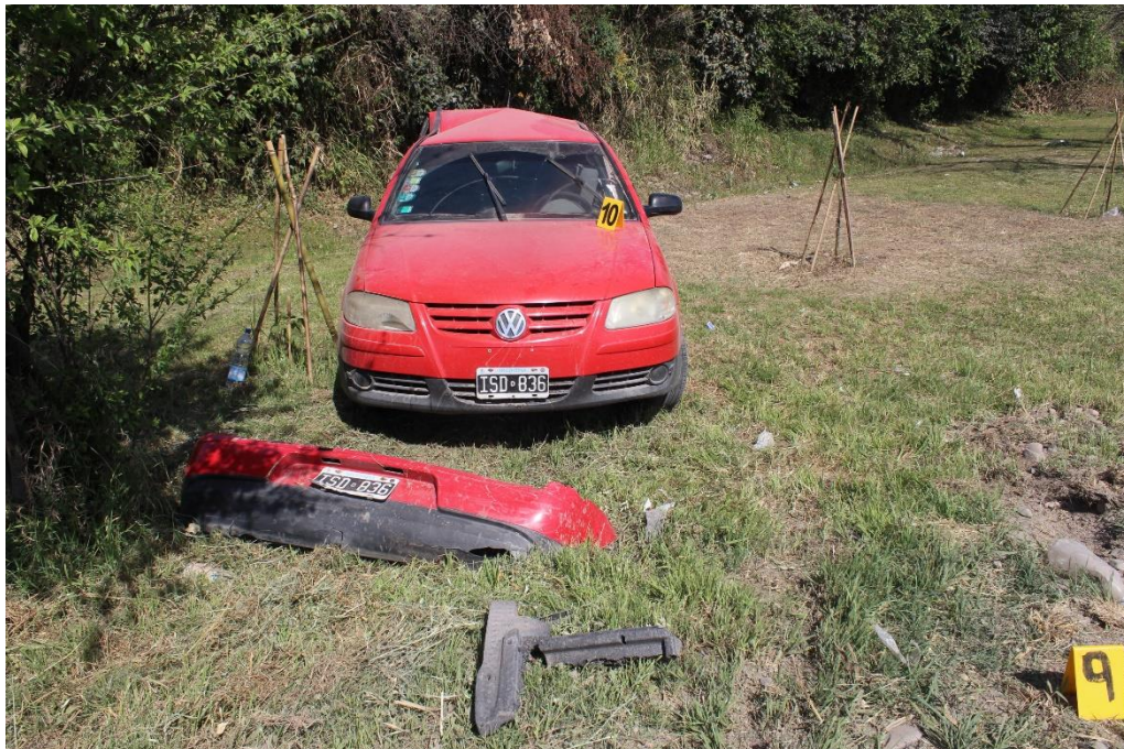
FOTOGRAFIA N° 23: Toma en aproximación donde se observan autopartes sobre el suelo y un vehículo marca Volkswagen, color rojo, indicado con el cartel N° 10.