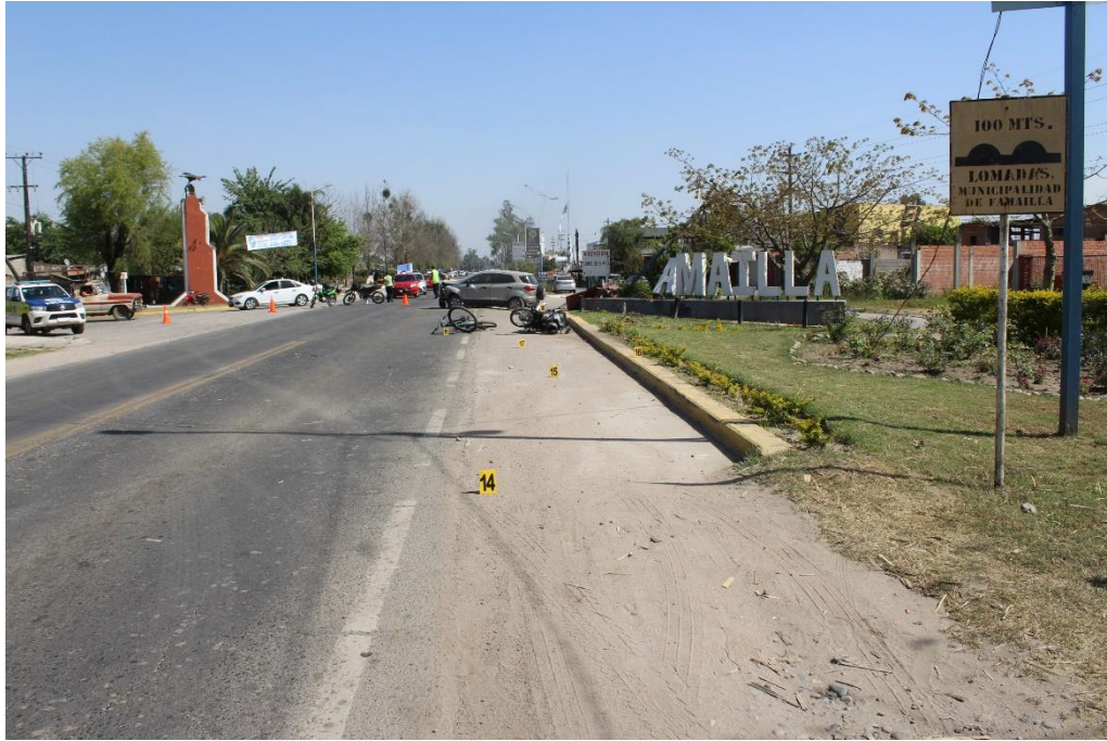
FOTOGRAFIA N° 38: Panorámica en aproximación a la continuidad de la banquina, donde se observa la ubicación de los indicios señalados con los carteles N° 14 y 15.