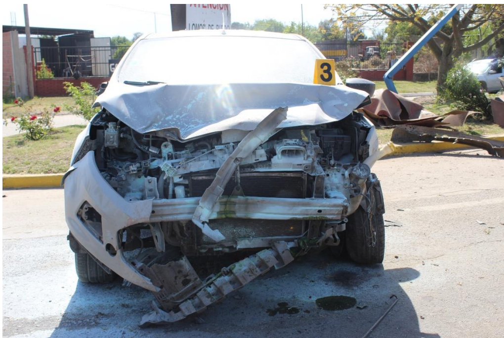
FOTOGRAFIA N° 67: Vista frontal de la camioneta señalada con el cartel N° 3, donde se aprecia su posición final y los daños visibles en su parte frontal.