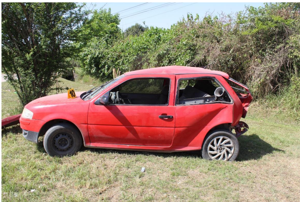
FOTOGRAFIA N° 25: Toma del lateral izquierdo del automóvil, donde se observa su posición y estado.