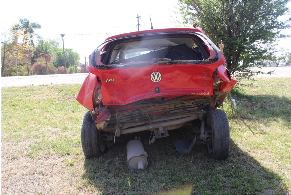
FOTOGRAFIA N° 26: Toma posterior del vehículo, donde se aprecia los daños estructurales en el sector trasero.