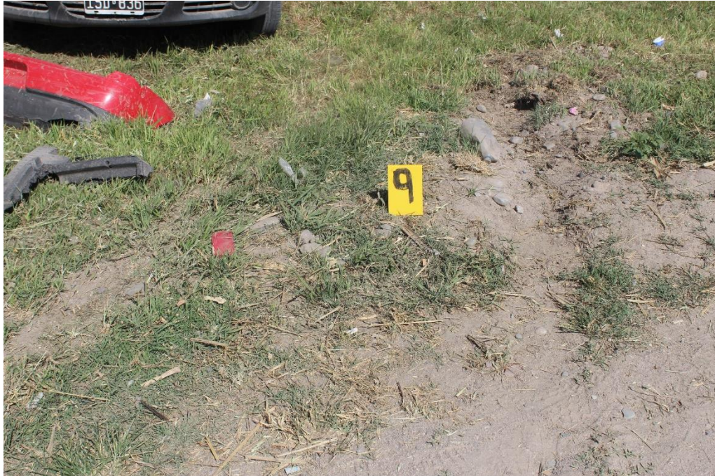
FOTOGRAFIA N° 22: Detalle de la alteración en el extremo final de la banquina Sur-Norte.