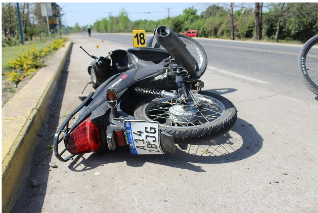
FOTOGRAFIA N° 49: Vista posterior de la motocicleta donde se aprecia su dominio A142BJG, ubicación y posición final.