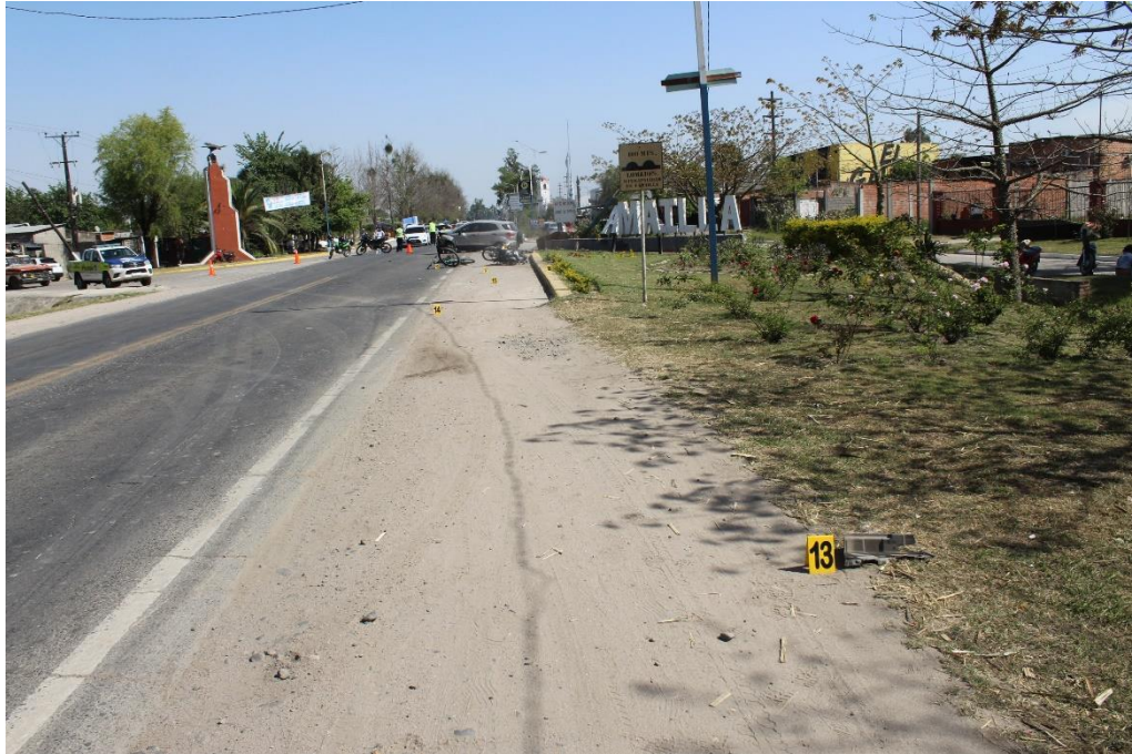
FOTOGRAFIA N° 36: Toma panorámica desde la banquina de tierra compacta Norte-Sur, donde se observa el cartel N° 13 señalando restos de autopartes sobre la superficie.