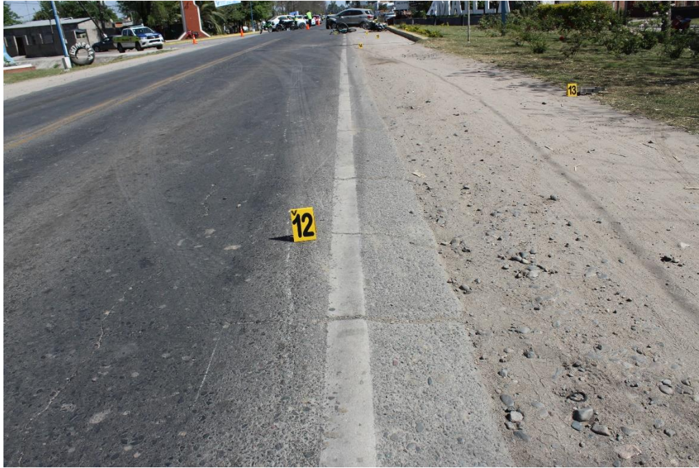
FOTOGRAFIA N° 34: Toma en aproximación a la prolongación de la huella de fricción metálica sobre el carril Norte-Sur, señalada con el cartel N° 12.