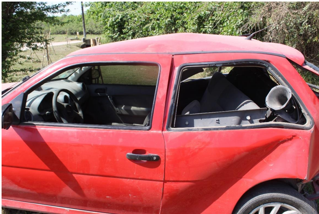
FOTOGRAFIA N° 29: Detalle del lateral izquierdo del automóvil, donde se observan los daños presentes.