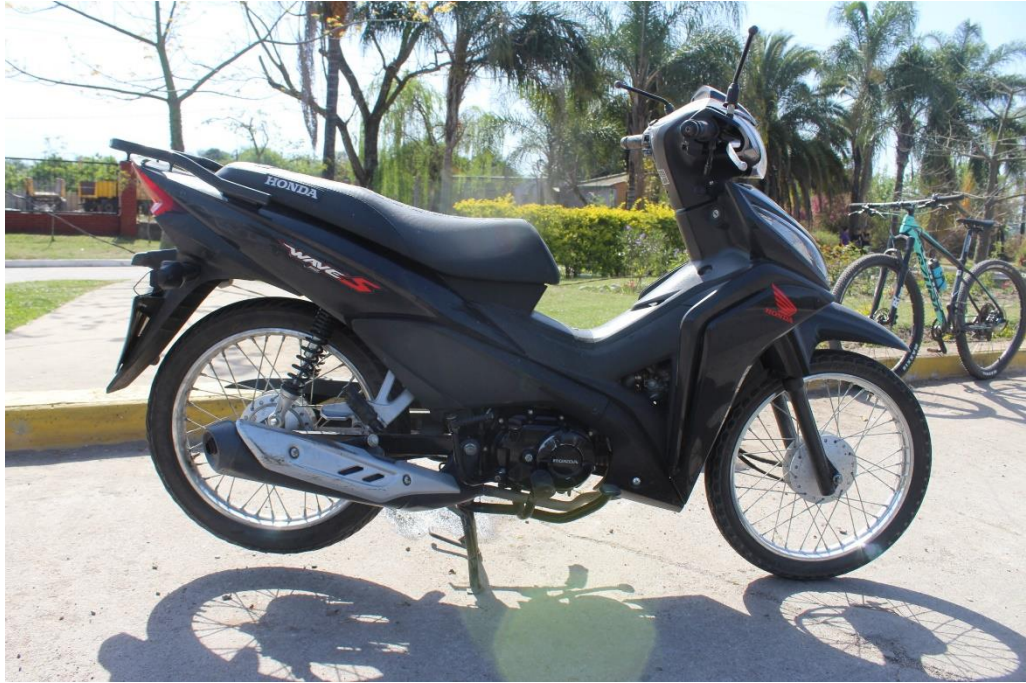
FOTOGRAFIA N° 72: Vista lateral derecha de la motocicleta, donde se aprecia su estado.