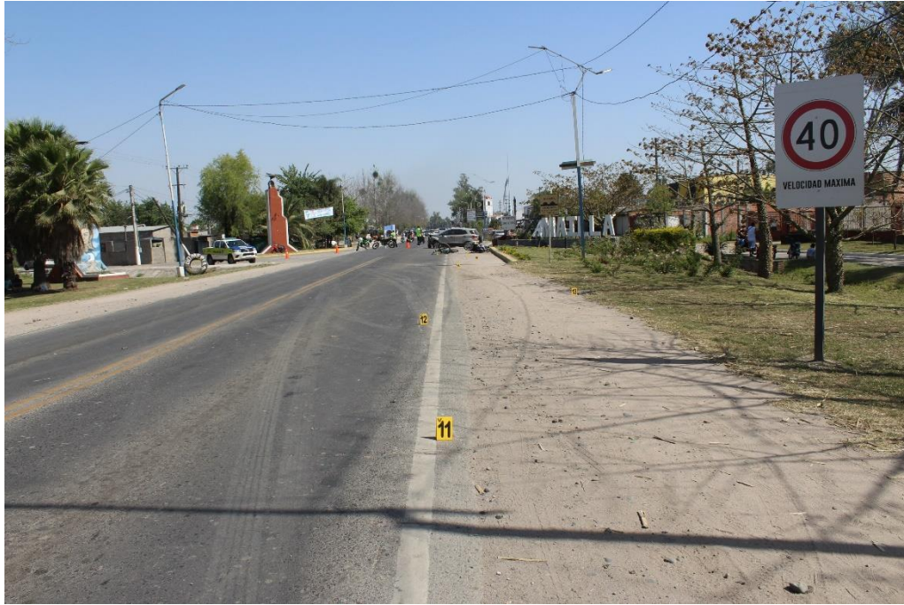
FOTOGRAFIA N° 32: Panorámica tomada desde el carril Norte-Sur, donde se visualiza la ubicación de los carteles indicadores N° 11 y N° 12.