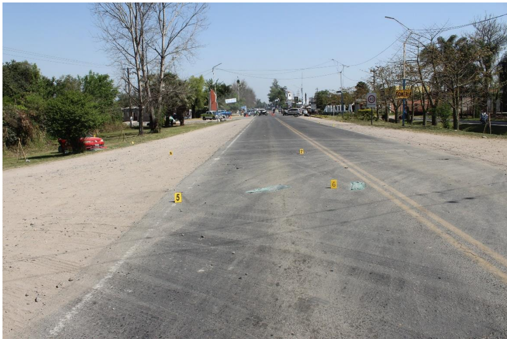
FOTOGRAFIA N° 13: Toma en aproximación del carril con sentido Sur-Norte, donde se aprecia la ubicación de los indicios N° 5, 6 y 7.