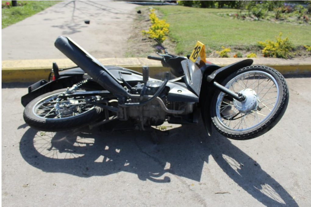
FOTOGRAFIA N° 50: Vista inferior de la motocicleta, donde se observa su posición, lugar de descanso final y estado estructural.