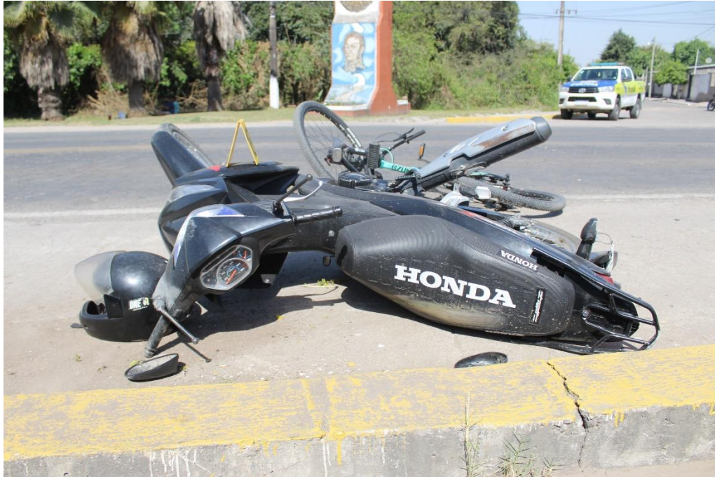
FOTOGRAFIA N° 48: Vista superior de la motocicleta volcada sobre su lateral izquierdo en la banquina asfaltada.