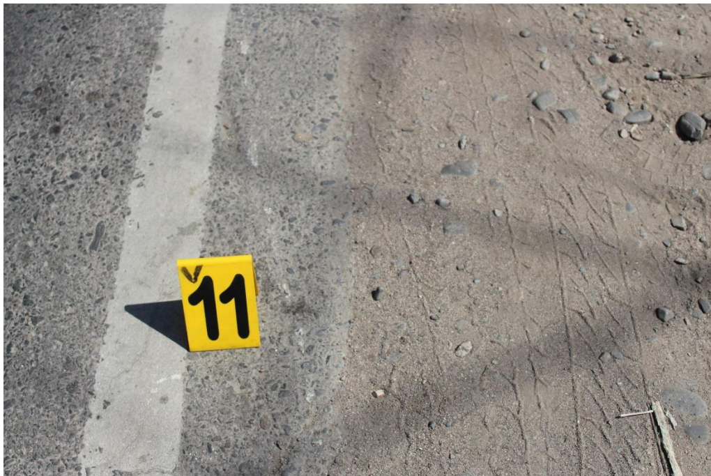
FOTOGRAFIA N° 33: Detalle de huella de fricción metálica sobre el límite del carril, indicada con el cartel N° 11.