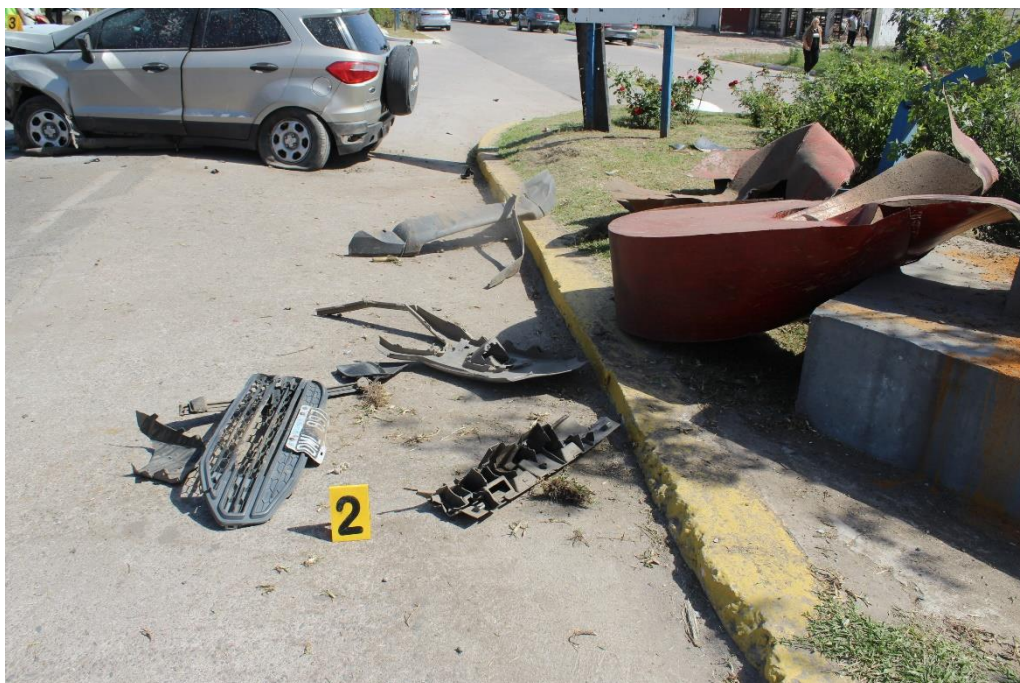
FOTOGRAFIA N° 59: Toma panorámica desde la banquina en sentido Norte–Sur, donde se observan restos de autopartes. En segundo plano se aprecia una camioneta posicionada en sentido transversal entre banquina y calzada.