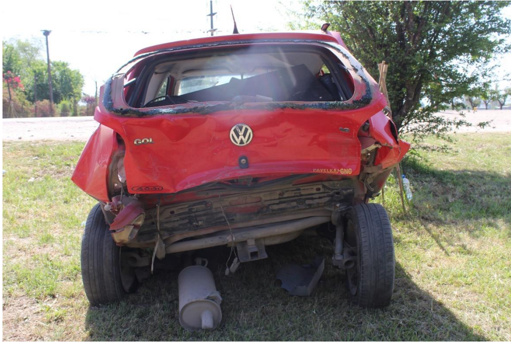
FOTOGRAFIA N° 28: Detalle de la parte posterior del automóvil, donde se aprecian los daños visibles.