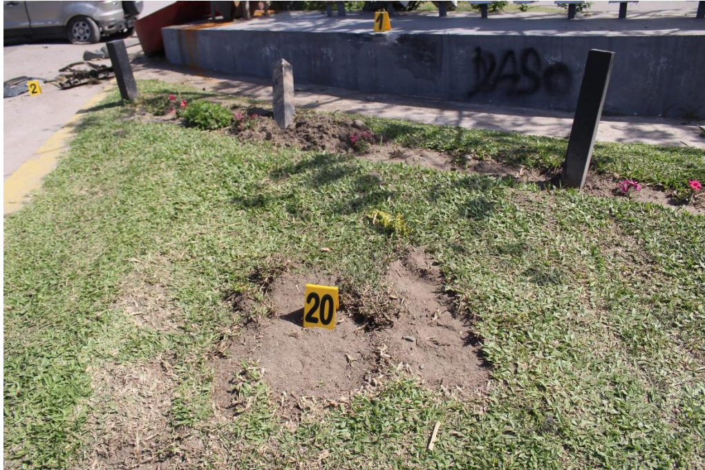
FOTOGRAFIA N° 56: Toma en aproximación de huella de fricción sobre la vereda con césped, señalada con el cartel N° 20.