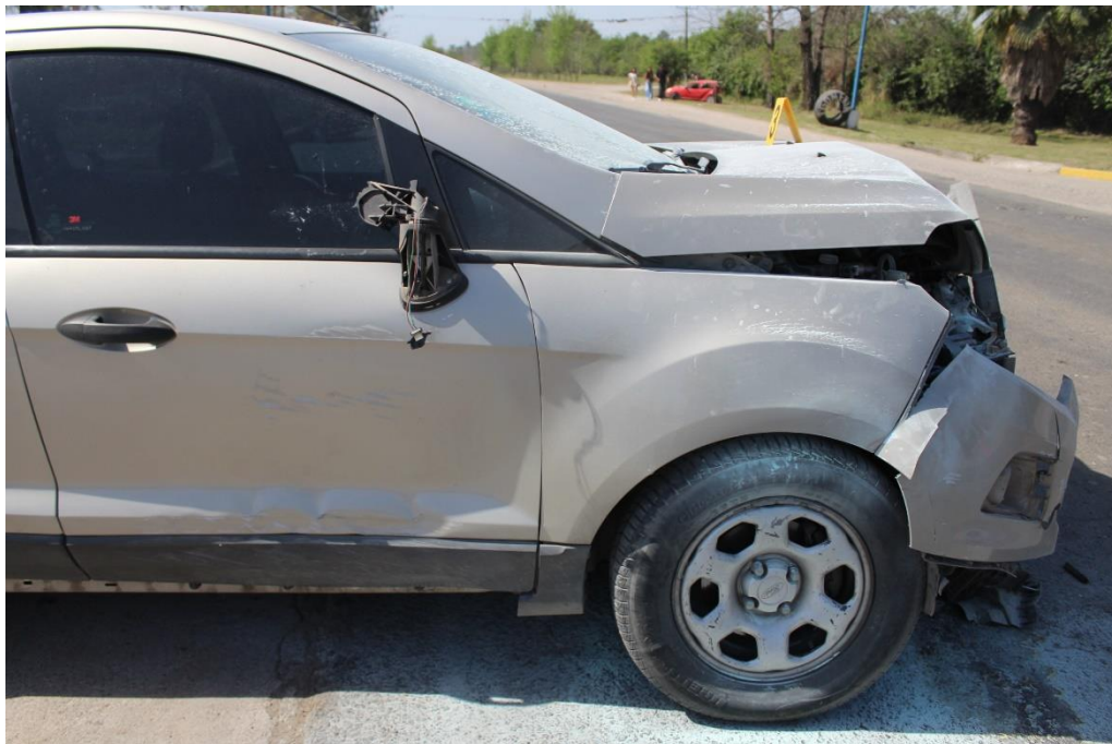
FOTOGRAFIA N° 69: Detalle del lateral derecho de la camioneta, donde se aprecian los daños.