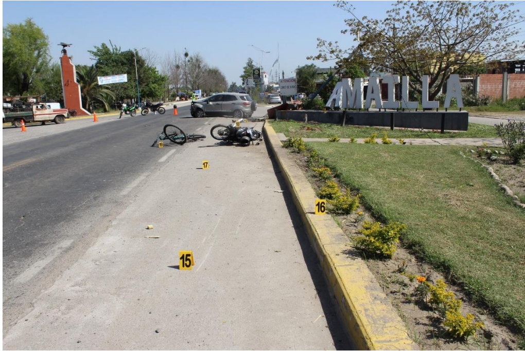
FOTOGRAFIA N° 40: Toma panorámica donde se visualiza la ubicación de los indicios señalados con los carteles N° 15, 16 y 17.