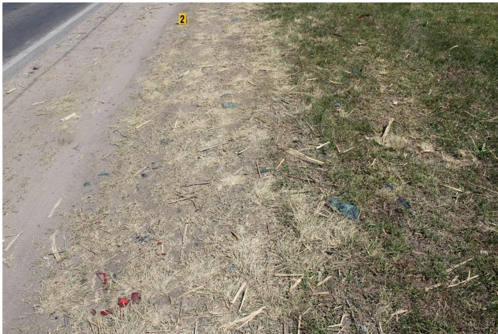
FOTOGRAFIA N° 7: Toma en aproximación donde se observan fragmentos de autopartes dispersos sobre la banquina.