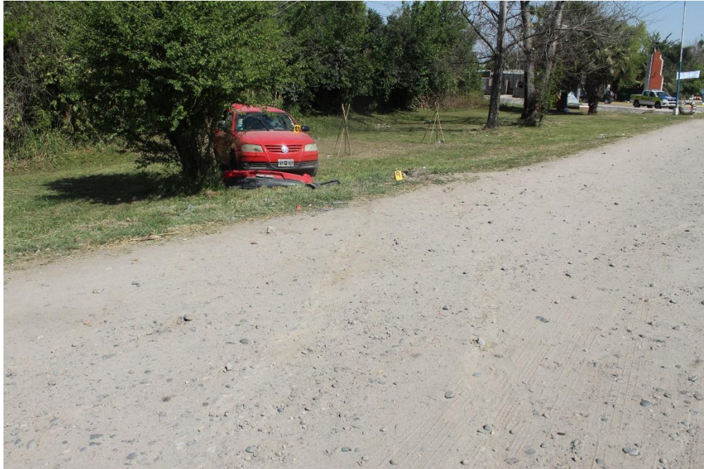
FOTOGRAFIA N° 20: Toma realizada desde la banquina Sur-Norte, donde se observa en el margen de la calzada de tierra compactada, específicamente en su finalización, el cartel N° 9 indicando alteración en la banquina, y el cartel N° 10 señalando un automóvil color rojo.