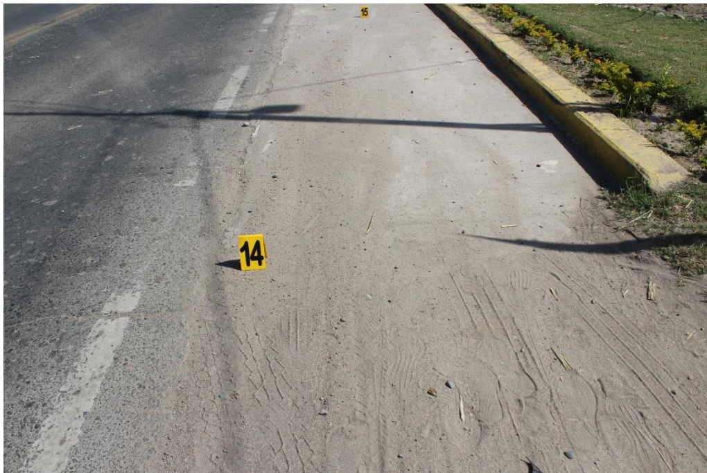
FOTOGRAFIA N° 39: Toma en aproximación donde se aprecia tierra disuelta entre la banquina no pavimentada y el carril de circulación.