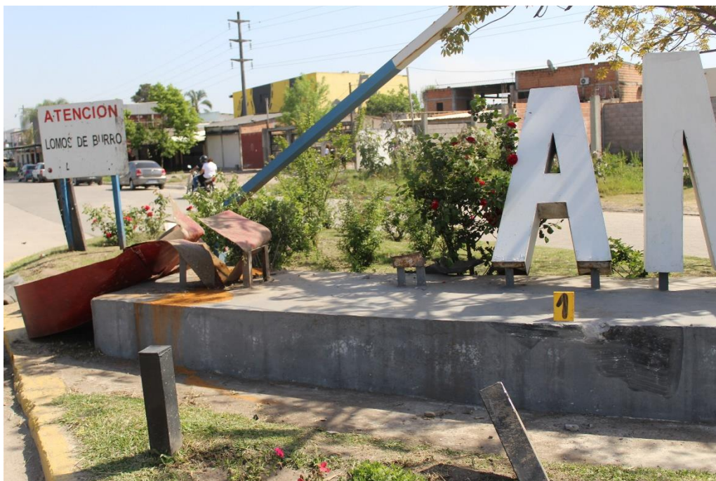
FOTOGRAFIA N° 57: Toma en aproximación donde se observan daños en las letras del cartel jurisdiccional y huella de fricción sobre su base, señaladas con el cartel N° 1.