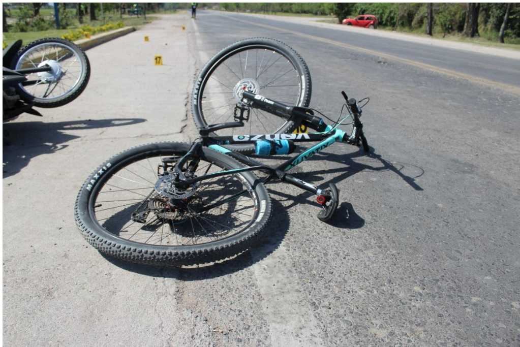
FOTOGRAFIA N° 53: Vista posterior de la bicicleta, donde se aprecia su estado y posición.