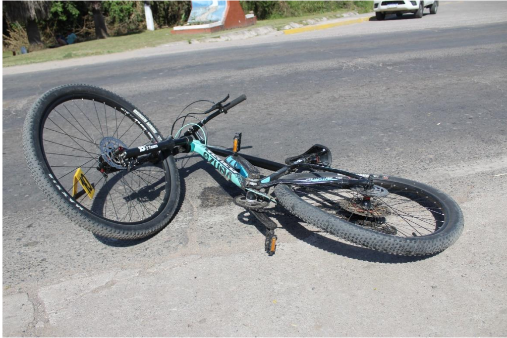
FOTOGRAFIA N° 52: Vista inferior de la bicicleta, donde se observa su ubicación y posición final.