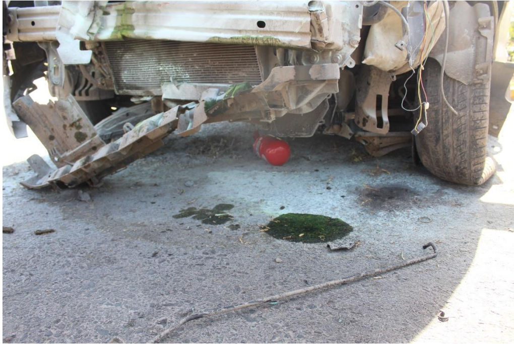
FOTOGRAFIA N° 68: Detalle de la carpeta asfáltica del carril Norte–Sur donde se observa polvo extintor, en la parte inferior frontal del vehículo se aprecia un matafuego y daños estructurales en dicha zona.