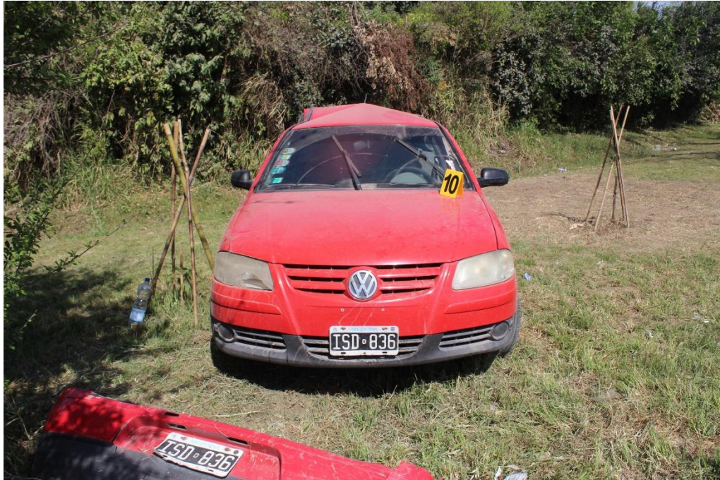
FOTOGRAFIA N° 24: Toma frontal del automóvil marca Volkswagen, modelo Gol, color rojo, dominio ISD 836. Se documenta su posición final y el estado general de su estructura.