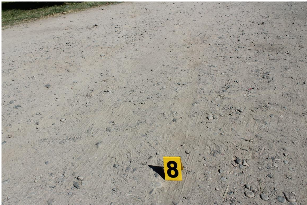
FOTOGRAFIA N° 19: Detalle de la continuación de huella de efracción sobre banquina de tierra compacta.