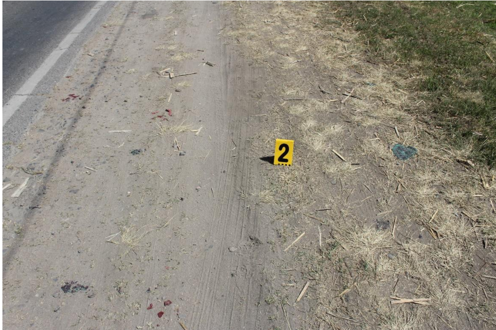
FOTOGRAFIA N° 8: Detalle de los fragmentos de acrílico correspondientes a autopartes.