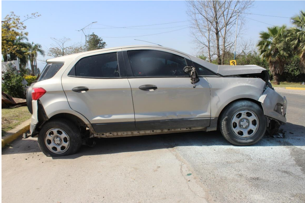
FOTOGRAFIA N° 66: Vista lateral derecha de la camioneta Ford, donde se observa su estado general.