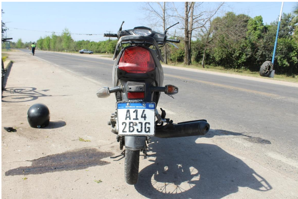
FOTOGRAFIA N° 71: Vista posterior de la motocicleta donde se observa su dominio A142BJG y su estado.