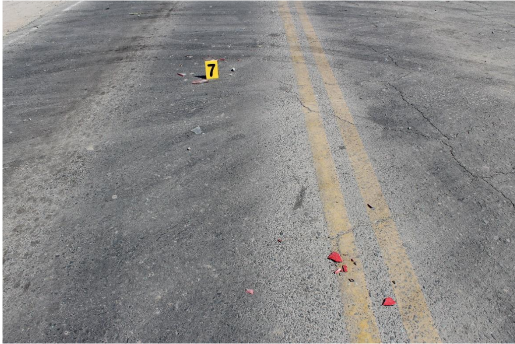
FOTOGRAFIA N° 16: Toma en aproximación donde se observan restos de autopartes sobre la calzada.