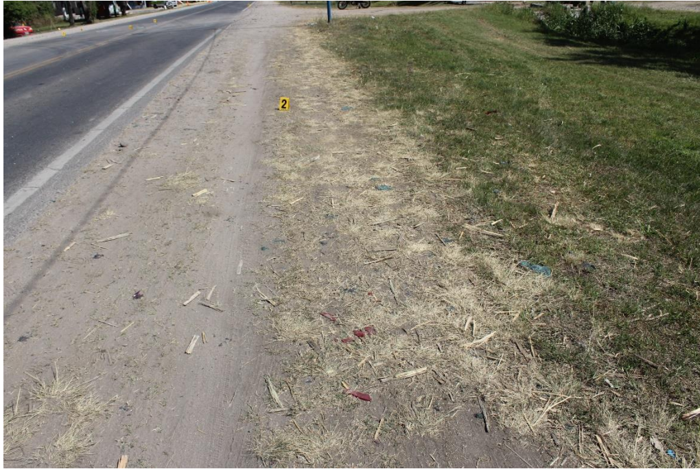
FOTOGRAFIA N° 6: Toma realizada desde banquina de tierra compacta donde se observa sobre la misma cartel indicador N°2, señalando fragmentos de autopartes sobre la misma.