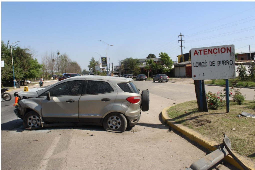
FOTOGRAFIA N° 63: Toma en aproximación donde se observa una camioneta ubicada transversalmente entre la banquina asfaltada y el carril Norte–Sur, apreciándose su posición final y estado.