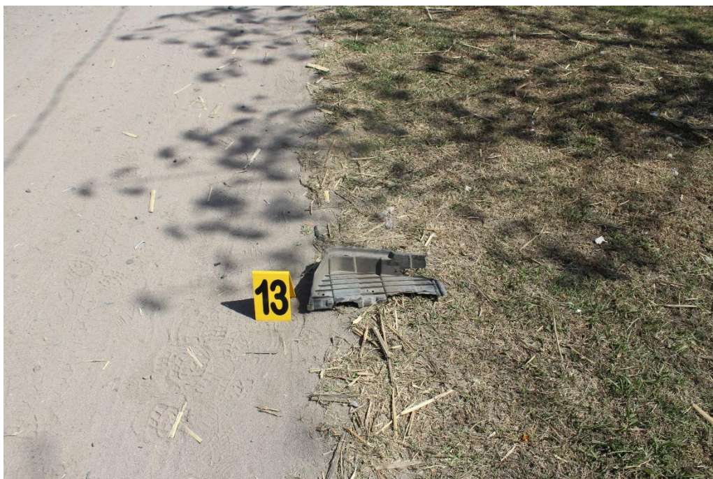
FOTOGRAFIA N° 37: Toma en aproximación del indicio N° 13, correspondiente a restos de autopartes ubicados en la terminación de la banquina.