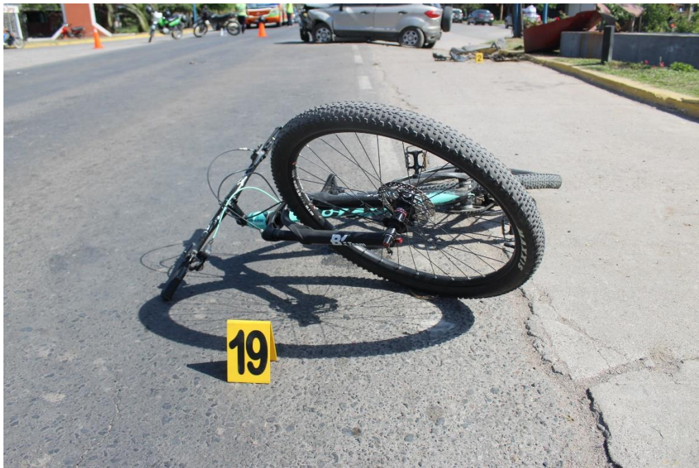
FOTOGRAFIA N° 51: Detalle del indicio señalado con el cartel N° 19. Vista frontal de la bicicleta sobre el carril de circulación, indicado con el cartel N°19.