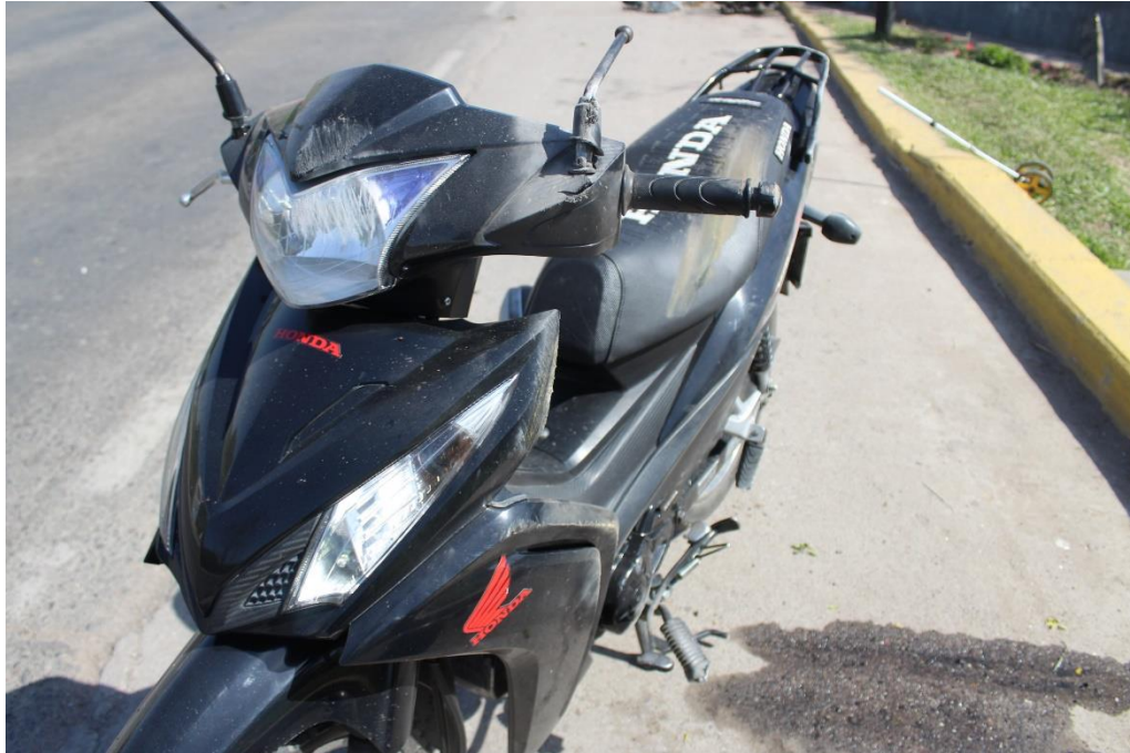
FOTOGRAFIA N° 74: Vista parcial de la motocicleta donde se observan daños.