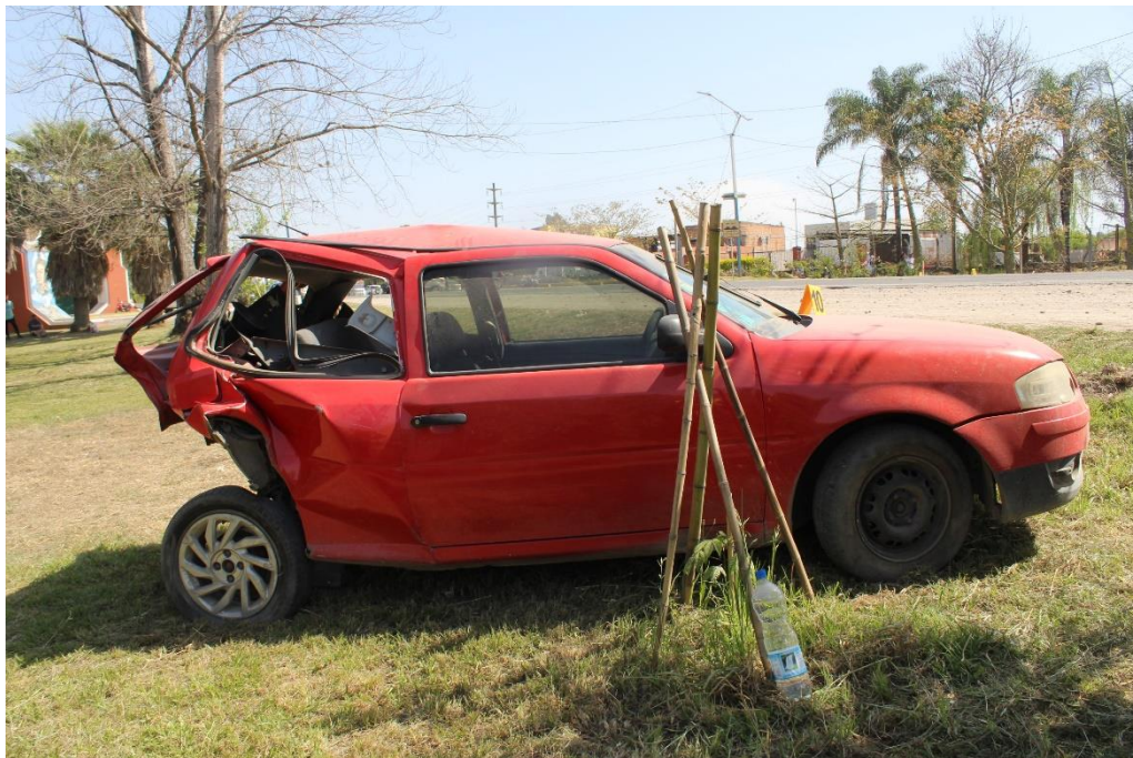
FOTOGRAFIA N° 27: Detalle del lateral derecho del automóvil, donde se observa su posición y estado.