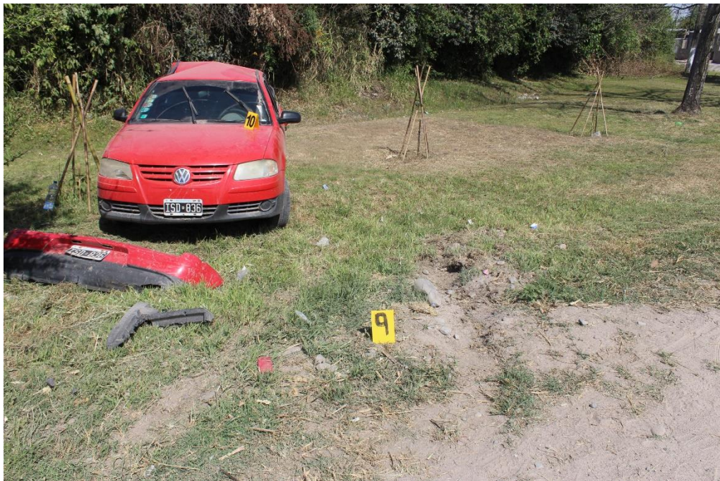
FOTOGRAFIA N° 21: Toma en aproximación donde se aprecia la alteración sobre el final de la banquina de tierra compactada y el automóvil color rojo.