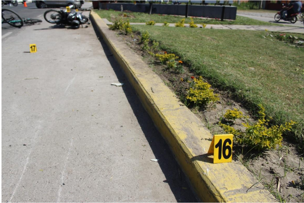
FOTOGRAFIA N° 42: Toma en aproximación del inicio de una huella de fricción sobre el cordón y su continuación hacia el cantero con vegetación indicado con el cartel N° 16.