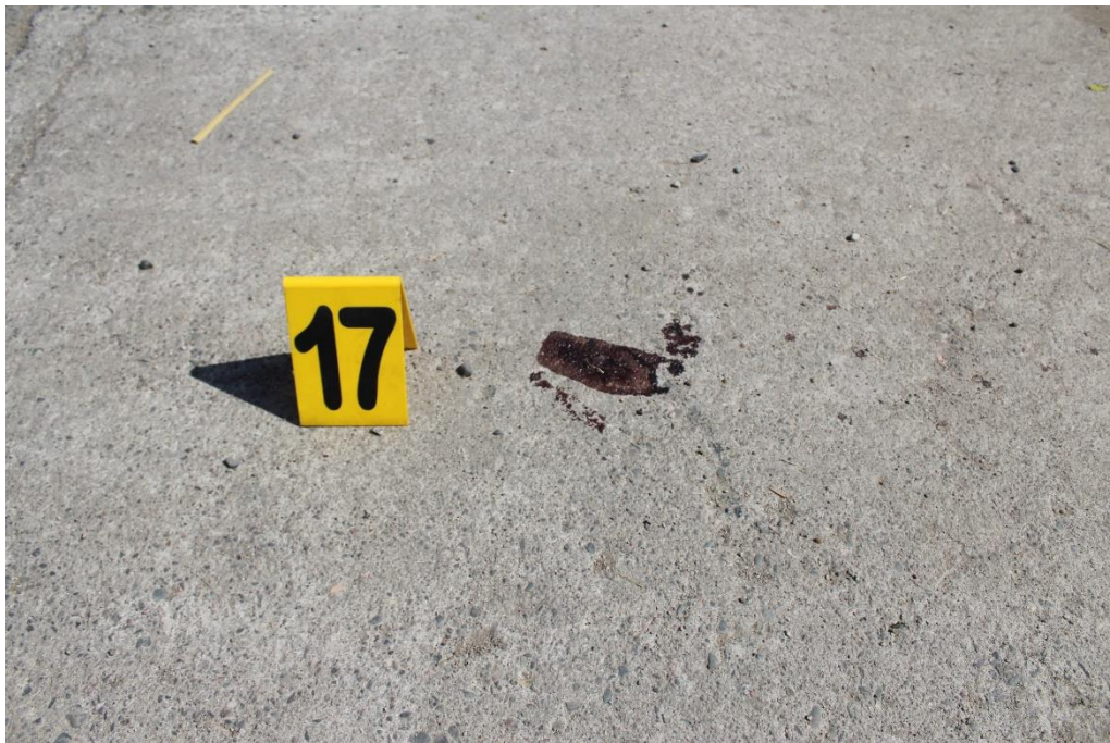
FOTOGRAFIA N° 45: Detalle en aproximación de mancha de color pardo rojizo sobre la carpeta asfáltica, señalada con el cartel N° 17.