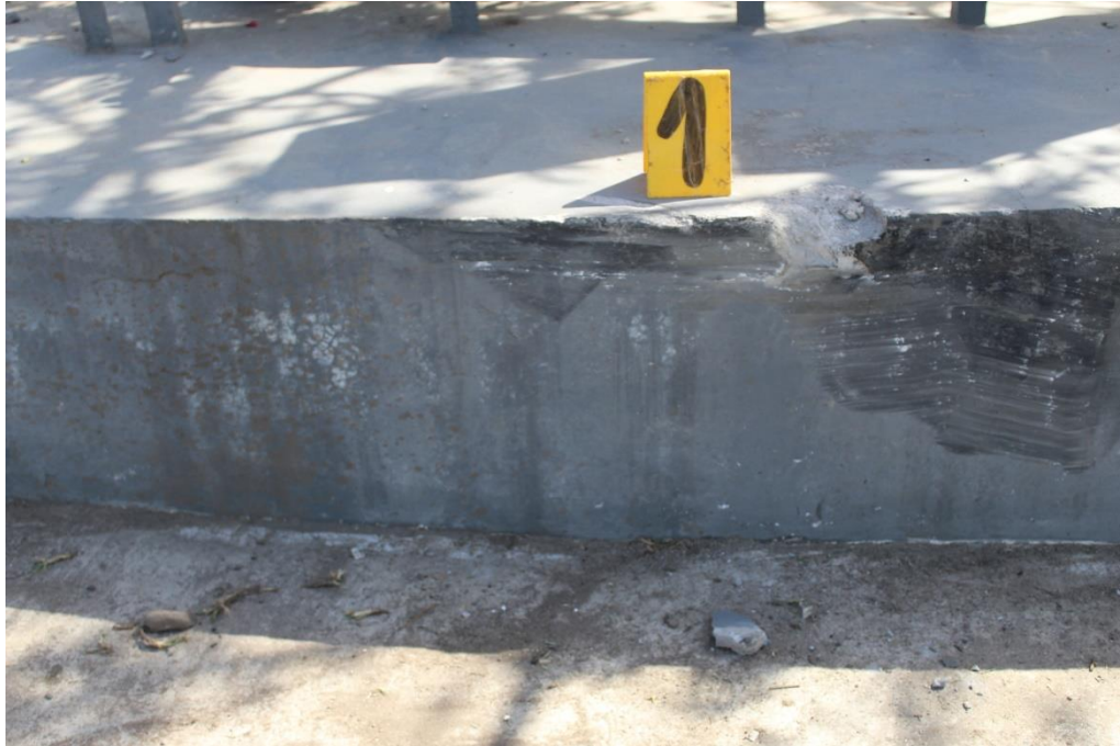
FOTOGRAFIA N° 58: Detalle de la huella de fricción sobre la base de las letras del cartel de ingreso.