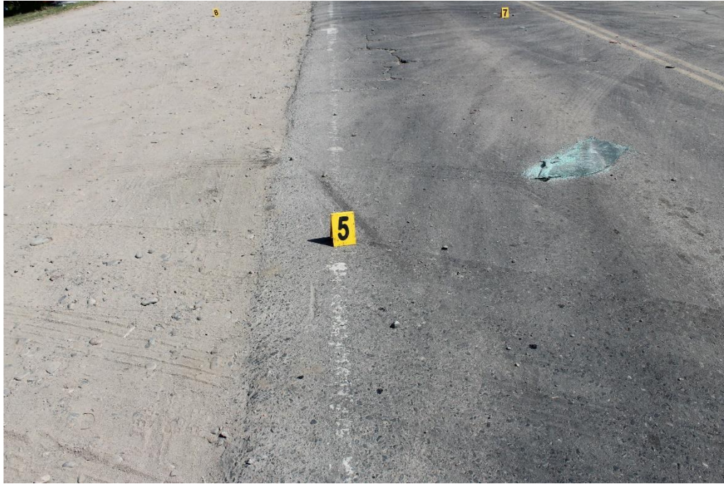
FOTOGRAFIA N° 14: Detalle en aproximación del indicio señalado con el cartel N° 5, correspondiente a una huella de fricción neumática sobre la línea blanca que delimita el carril Sur-Norte y se extiende hacia la banquina de tierra compacta.